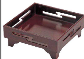
㉒ 1-625-5 A 6寸角足付透かし盛器 溜 ¥3,300 (17.8×17.8×7.1) 幅60 (内寸 17×17×H3.8)