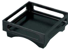
① 1-624-1 A 5.5寸日野盛器 黒 ¥2,000 (16.8×16.8×6.5) 幅60 (内寸 15.5×15.5×H3.7)