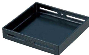
㉑ 新6寸角透かし盛器 黒 1-625-11 ¥1,450 (18.8×18.8×3.8) 幅60 (内寸 18×18×H2.9)