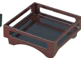
② 1-624-2 A 5.5寸日野盛器 溜 ¥2,500 (16.8×16.8×6.5) 幅60