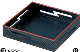
⑬ 1-625-1 A 6寸角透かし盛器 黒天朱 ¥1,550 (17.8×17.8×4.3) 幅60 (内寸 17×17×H3.8)