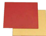
㉔ 新6寸角透かし盛器用中皿 朱千筋/金 1-625-12 ¥1,200 (17.4×17.4×0.2) 幅200