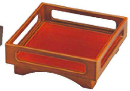
③ M-39-30 A 5.5寸日野盛器 漆調春慶塗 ¥3,200 (16.8×16.8×6.5) 幅60