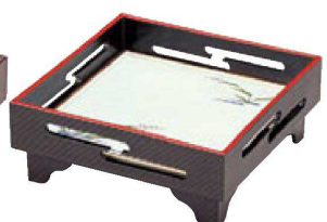
㉓ 6寸角足付透かし盛器 黒天朱 本体 1-625-3 ¥2,700 (17.8×17.8×7.1) 幅60