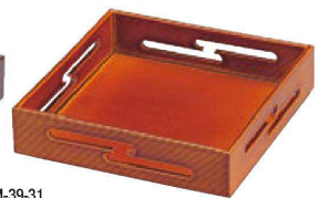
⑮ M-39-31 A 6寸角透かし盛器 漆調春慶塗 ¥3,000 (17.8×17.8×4.3) 幅60