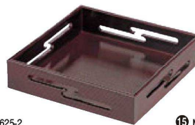
⑭ 1-625-2 A 6寸角透かし盛器 溜 ¥1,900 (17.8×17.8×4.3) 幅60