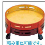
積み重ね可能です。