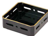
⑪ 1-327-4 A ミニ隅切透かし鉢 黒天金 ¥1,100 (11.3×11.3×4) 棚100 (内寸 隅切 10.7×10.7×H3.2)