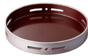
⑦ M-39-75 A 6寸丸透かし盛器 銀朱かすみ天銀 ¥2,500 (18φ×3.1) 棚80 (内寸 17.2φ×2.5)