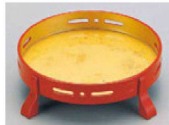
⑨ 1-640-10 A 6.5寸丸透かし足付盛器 朱内色紙金箔 S・H 塗 ¥3,600 (23×19φ×5.7) 棚50