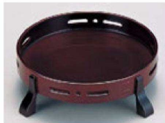
⑧ 1-640-11 A 6.5寸丸透かし足付盛器 溜底黒塗 S・S 塗 ¥3,800 (23×19φ×5.7) 棚50 (内寸 φ18.2×H2.6)