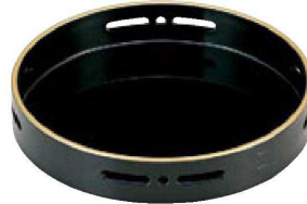
⑥ 1-640-6 A 7寸丸透かし盛器 黒天金 ¥2,000 (20.3φ×3.6) 棚40