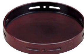
③ 1-640-9 A 7寸丸透かし盛器 溜底黒塗 S・S 塗 ¥3,100 (20.3φ×3.6) 棚40 (内寸 φ19.4×H3)