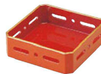
⑫ 1-327-3 A ミニ隅切透かし鉢 朱天金 ¥1,100 (11.3×11.3×4) 棚100