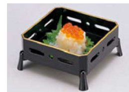
⑬ 1-627-3 A ミニ隅切透かし足付盛器 黒天金 ¥1,950 (12.3×12.3×5.1) 棚100 (内寸 隅切 10.7×10.7×H3.2)