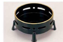
⑯ 1-640-3 A ミニ丸透かし足付盛器 黒天金 ¥1,950 (13.3φ×5.5) 棚100 (内寸 φ10.8×H3.2)

S・S 塗 ソフトでキズに対して復元力があり、汚れが附着しにくく、丈夫で器の艶も長く保ちます。