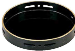
⑤ 1-640-5 A 6.5寸丸透かし盛器 黒天金 ¥1,900 (19φ×3.3) 棚50