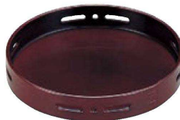
② 1-640-8 A 6.5寸丸透かし盛器 溜底黒塗 (中皿別売) S・S 塗 ¥2,700 (19φ×3.3) 棚50 (内寸 φ18.2×H2.6)