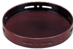
① 1-640-7 A 5.5寸丸透かし盛器 溜底黒塗 S・S 塗 ¥2,400 (17φ×3.2) 棚60 (内寸 φ16.4×H2.6)