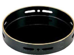
④ 1-640-4 A 5.5寸丸透かし盛器 黒天金 ¥1,600 (17φ×3.2) 棚60