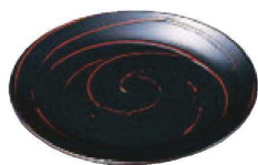
内底面が平面の丸皿

⑧ M-7-74 TM 6寸春秋皿 一筆曙 ¥3,000 (18φ×1.7) 梱150