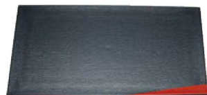
⑦ M-38-80 A 8.5寸京風隅折皿 黒測朱 ¥1,700 (25.5×18×1.4)