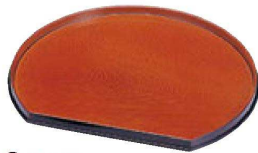
③ M-1-35 A 7.5寸木目半月皿 春慶測黒 ¥1,100 (22.7×19.8×1.5) 欄100