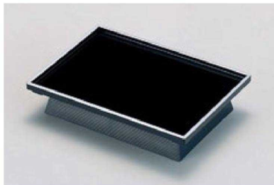
⑭ A 長角高台皿 黒天銀 1-633-5 ¥2,350 (21.5×15.4×4.7) 欄50 足取り外し式