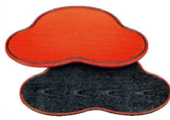
⑧ 1-657-5 A 松皿 黒木目天朱/朱天黒 ¥1,300 (25.3×15.7×0.7) 欄200