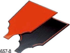
⑩ 1-657-8 A 新はご板 朱天黒/黒千筋天朱 ¥1,200 (30×17.5×0.7) 欄150