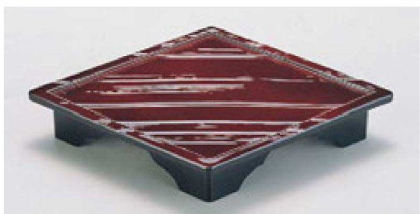
⑬ 1-652-2 A 菱型高台盛皿 溜春慶 ¥1,600 (32×24×4.5) 欄60