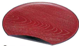
① M-1-33 A 8.5寸日ノ出半月皿 ウルミ天黒 ¥1,250 (25.5×23×1) 欄80 ② M-1-32 A 6寸日ノ出半月皿 ウルミ天黒 ¥850 (17.9×16.1×0.9) 欄100