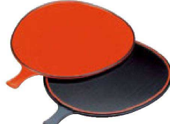
⑨ 1-657-7 A うちわ両面皿 朱天黒/黒千筋天朱 ¥1,200 (27×21.3×0.7) 欄200