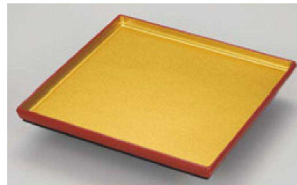
⑯ A 8.5寸角足付四方盆 金雅 測朱 M-37-26 ¥4,200 (25.5×25.5×5) 欄40 足取り外し式