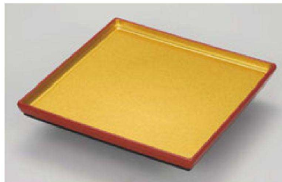
⑮ A 8寸角足付四方盆 金雅 測朱 M-37-25 ¥3,500 (23.6×23.6×5) 欄40 足取り外し式