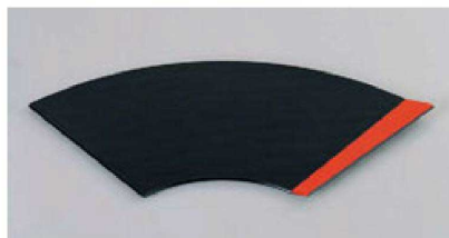
⑫ 1-657-12 A 尺2寸扇面隅折皿 黒測朱 ¥1,150 (35.6×15.5×1.5) 欄80