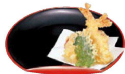
⑤ 1-653-11 A 半月皿 黒天朱 ¥1,600 (22.9×20.5×2.7) 欄100