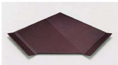
⑪ 1-657-9 A むすび皿 溜 ¥1,100 (29.5×18×1.1) 欄150