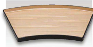
① 1-645-5 TM 扇面皿 溜天金 ¥3,300 (28.8×16.5×1.8) 楕80