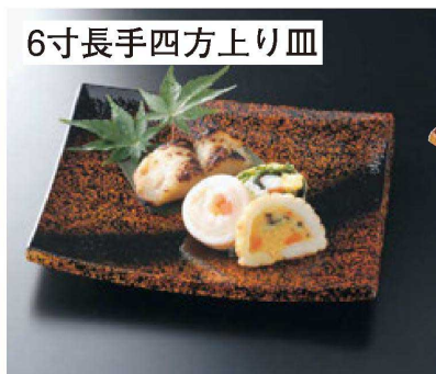
6寸長手四方上り皿