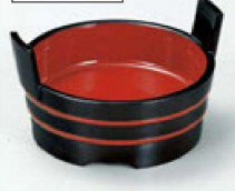
① S-7-44 A 4寸両手桶 黒帯朱 ¥1,200 (12φ×7.5) 欄80 (内寸φ10.5×H2.8)