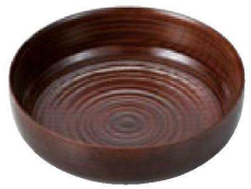
㉙ M-33-91 A 5寸木目乱筋小鉢 柝 ¥2,300 (15.5φ×4.5)