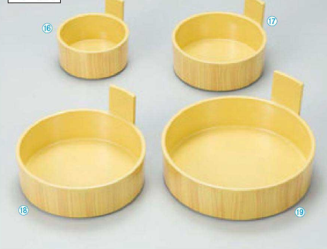
⑯ M-35-5 A 3.5寸手桶 白木塗 ¥1,500 (10.4φ×7.8) 欄100 (内寸8.9φ×4.3)