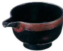
㉗ M-12-27 A 布張片口鉢 曙 ¥1,850 (14.5×11.8×7.9) 欄60 380cc