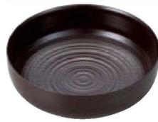
㉘ M-33-90 A 5寸木目乱筋小鉢 艶消新溜 ¥1,150 (15.5φ×4.5)