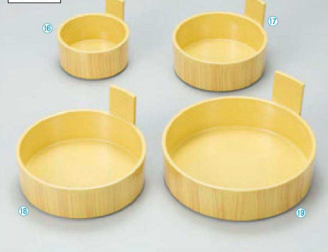
⑯ M-35-5 A 3.5寸手桶 白木塗 ¥1,500 (10.4φ×7.8) 欄100 (内寸8.9φ×4.3)