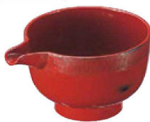
㉖ M-12-26 A 布張片口鉢 根来 ¥1,650 (14.5×11.8×7.9) 欄60 380cc