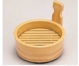
A 5寸片手桶 白木金帯 ⑧ 1-540-6 本体 ¥2,200 (14.8×13.9×11.8) 欄80 (内寸φ12×H4.5) ⑨ 1-658-1A ABS目皿 ¥800 (11.9φ×2) 欄200