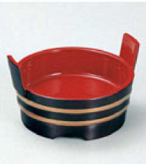
③ S-7-46 A 4寸両手桶 溜帯金 ¥1,450 (12φ×7.5) 欄80 (内寸φ10.5×H2.8)