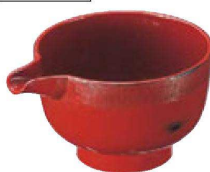
㉖ M-12-26 A 布張片口鉢 根来 ¥1,650 (14.5×11.8×7.9) 欄60 380cc