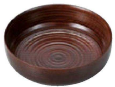
㉙ M-33-91 A 5寸木目乱筋小鉢 柝 ¥2,300 (15.5φ×4.5)