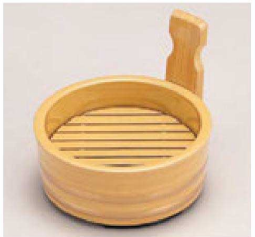
A 6寸片手桶 白木金帯 ⑭ 1-540-9 本体 ¥2,300 (17.5×16.7×14) 欄60 (内寸φ14.8×H5.2) ⑮ 1-658-4A ABS目皿 ¥880 (14.7φ×2.4) 欄150