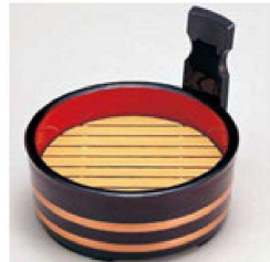
A 6寸片手桶 溜金帯内朱 ⑫ 1-540-10 本体 ¥2,200 (17.5×16.7×14) 欄60 (内寸φ14.8×H5.2) ⑬ 1-658-4A ABS目皿 ¥880 (14.7φ×2.4) 欄150