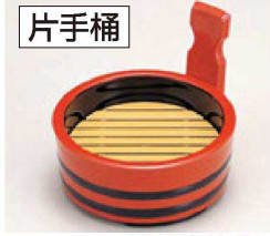
A 5寸片手桶 朱に帯黒 ④ 1-540-5 本体 ¥1,950 (14.8×13.9×11.8) 欄80 (内寸φ12×H4.5) ⑤ 1-658-1A ABS目皿 ¥800 (11.9φ×2) 欄200