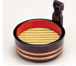
A 5寸片手桶 溜金帯内朱 ⑥ 1-540-7 本体 ¥2,100 (14.8×13.9×11.8) 欄80 (内寸φ12×H4.5) ⑦ 1-658-1A ABS目皿 ¥800 (11.9φ×2) 欄200