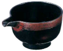
㉗ M-12-27 A 布張片口鉢 曙 ¥1,850 (14.5×11.8×7.9) 欄60 380cc