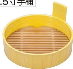
6.5寸手桶 白木塗 ㉔ M-35-8 A 本体 ¥2,400 (19.5φ×9.7) 欄60 ㉕ 1-706-1A AP スノ子17.5φ ¥650 (17.5φ) 欄200