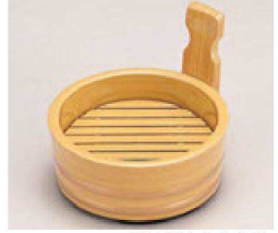
A 5寸片手桶 白木金帯 ⑧ 1-540-6 本体 ¥2,200 (14.8×13.9×11.8) 欄80 (内寸φ12×H4.5) ⑨ 1-658-1A ABS目皿 ¥800 (11.9φ×2) 欄200