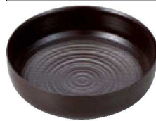
㉘ M-33-90 A 5寸木目乱筋小鉢 艶消新溜 ¥1,150 (15.5φ×4.5)