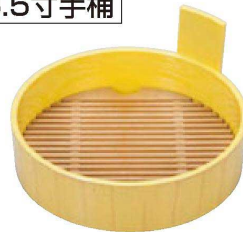
6.5寸手桶 白木塗 ㉔ M-35-8 A 本体 ¥2,400 (19.5φ×9.7) 欄60 ㉕ 1-706-1A AP スノ子17.5φ ¥650 (17.5φ) 欄200