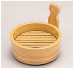
A 6寸片手桶 白木金帯 ⑭ 1-540-9 本体 ¥2,300 (17.5×16.7×14) 欄60 (内寸φ14.8×H5.2) ⑮ 1-658-4A ABS目皿 ¥880 (14.7φ×2.4) 欄150