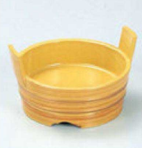
② S-7-45 A 4寸両手桶 白木帯金 ¥1,250 (12φ×7.5) 欄80 (内寸φ10.5×H2.8)