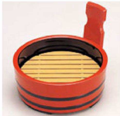
A 6寸片手桶 朱に帯黒 ⑩ 1-540-8 本体 ¥2,000 (17.5×16.7×14) 欄60 (内寸φ14.8×H5.2) ⑪ 1-658-4A ABS目皿 ¥880 (14.7φ×2.4) 欄150