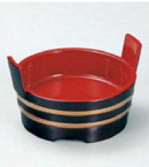
③ S-7-46 A 4寸両手桶 溜帯金 ¥1,450 (12φ×7.5) 欄80 (内寸φ10.5×H2.8)