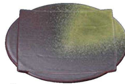
⑥ 1-603-8 TA 5.5寸色紙皿 岩織部 ¥2,750 (17φ×3.4) 楕80 (有効内寸13.2×13.2)