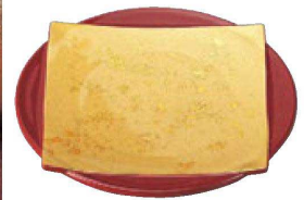
⑤ M-10-41 TA 5.5寸色紙皿 色紙金箔朱 S-H塗 ¥2,800 (17φ×3.4) 楕80 (有効内寸13.2×13.2)