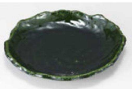
⑧ M-23-74 A 8寸鳴門盛器 織部(裏塗) ¥3,000 (25.2×21.9×3.8) 楕60