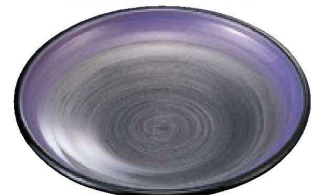
⑭ 1-600-9 TA 6寸錦盛皿 紫銀かすみ エース塗 ¥3,100 (17.8φ×3.4) 楕80

S-H塗 表面が硬質でキズ、汚れを防止します。 クリーン塗 塗りの密着度が大変強く、硬質でキズ、汚れを防止します。 エース塗 ソフトで復元力があり、キズ、汚れを防止します。