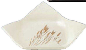
③ M-10-31 A 結び折皿 クリーム麦 ¥3,200 (26×20.7×5.5) 楕60