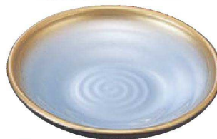
⑬ 1-684-11 TA 6寸錦盛皿 ブルー真珠塗 クリーン塗 ¥2,200 (17.8φ×3.4) 楕80