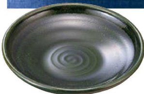
⑫ 1-600-2 TA 6寸錦盛皿 織部 ¥2,200 (17.8φ×3.4) 楕80 他の丸皿は420頁⇒