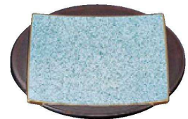
⑦ 1-603-9 TA 5.5寸色紙皿 吹墨測金 ¥3,000 (17φ×3.4) 楕80 (有効内寸13.2×13.2)