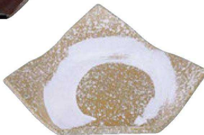
④ M-10-30 A 結び折皿 しぐれ一筆 ¥4,200 (26×20.7×5.5) 楕60