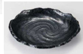
⑨ M-23-75 A 8寸鳴門盛器 新黒石目 ¥2,400 (25.2×21.9×3.8) 楕60