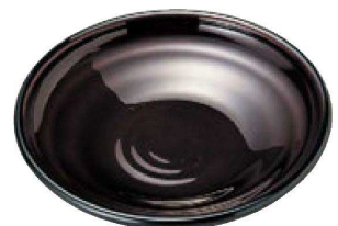
⑪ M-10-32 TA 6寸錦盛皿 溜 ¥2,000 (17.8φ×3.4) 楕80