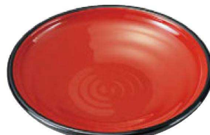
⑩ 1-684-1 TA 6寸錦盛皿 朱天黒 ¥1,650 (17.8φ×3.4) 楕80