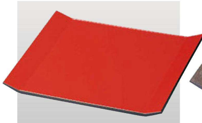
① M-8-15 A 9寸羽反盛皿 朱測黒 ¥950 (27.2×21.2×1.7) 櫃100