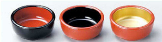
⑦ 1-339-26 A ミニ丸鉢 黒内朱 ¥550 (6.3φ×3.1) 櫃300 ⑧ 1-339-27 A ミニ丸鉢 朱内黒 ¥550 (6.3φ×3.1) 櫃300 ⑨ 1-339-28 A ミニ丸鉢 朱内金 ¥650 (6.3φ×3.1) 櫃300