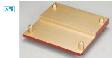
⑪ M-37-24 A D.Xひな段天皿 金燐 測朱/黒塗 ¥4,500 (22×22×5) 櫃40