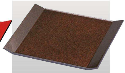
② M-1-36 A 9寸羽反盛皿 梨地 ¥950 (27.2×21.2×1.7) 櫃100