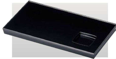
③ M-5-64 A 9.2寸長角盛器 黒 ¥1,450 (28×16×2) 櫃60