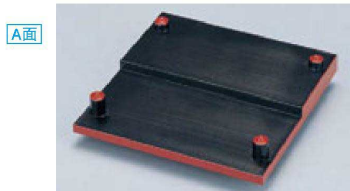
⑩ 1-634-1 A D.Xひな段天皿 梨地/黒千筋 ¥3,650 (22×22×5) 櫃40