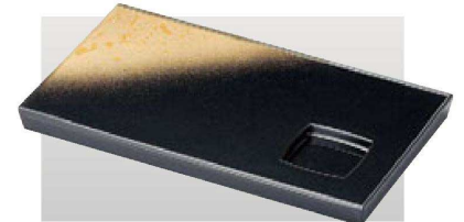
⑥ M-6-33 A 9.2寸長角盛器 パール色紙金箔 S.H塗 ¥2,500 (28×16×2) 櫃60