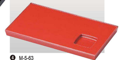
④ M-5-63 A 9.2寸長角盛器 本朱塗 ¥1,600 (28×16×2) 櫃60