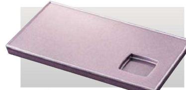
⑤ M-39-90 A 9.2寸長角盛器 藍錦パール塗 ¥2,000 (28×16×2) 櫃60