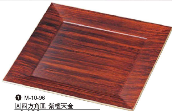
① M-10-96 A 四方角皿 紫檀天金 ¥4,100 (31.8×31.8×1.7) 櫃40 (有効内寸21.5×21.5)