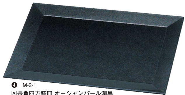
④ M-2-1 A 長角四方盛皿 オーシャンパール測黒 ¥3,800 (42.4×30.8×1.5) 櫃50 (有効内寸34×22.8)