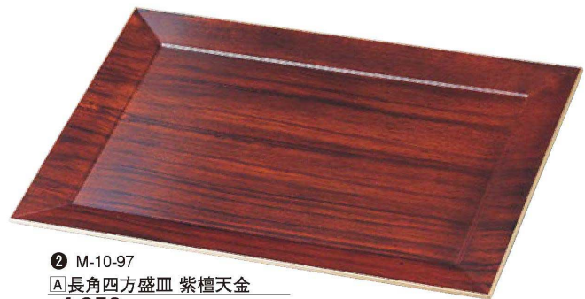
② M-10-97 A 長角四方盛皿 紫檀天金 ¥4,950 (42.4×30.8×1.5) 櫃50 (有効内寸34×22.8)