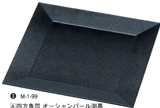
③ M-1-99 A 四方角皿 オーシャンパール測黒 ¥3,500 (31.8×31.8×1.7) 櫃40 (有効内寸21.5×21.5)