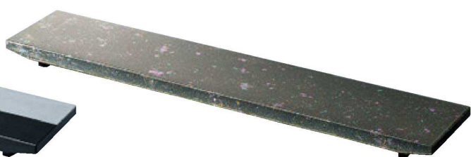
TA 桃山長角盛台 銀黒市松(裏塗)