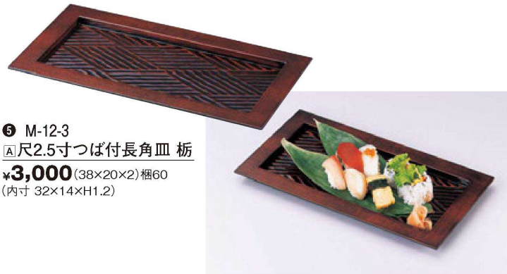
⑤ M-12-3 A尺2.5寸つば付長角皿 柘 ¥3,000 (38×20×2) 櫃60 (内寸 32×14×H1.2)