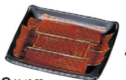
⑦ M-10-55 TM 5寸吉野長角皿 錆刷毛目 ¥3,200 (14×12.5×1.5) 櫃100