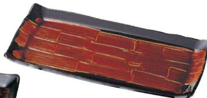
⑨ M-10-57 TM 尺1寸吉野長角皿 錆刷毛目 ¥7,100 (33.3×17.3×2.5) 櫃80