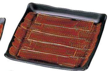
⑩ M-10-58 TM 7寸吉野角皿 錆刷毛目 ¥5,900 (21×21×2) 櫃80