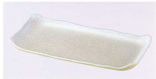
⑥ M-12-2 M尺4寸山道長角盛器 粉引 ¥8,900 (43.3×23×4.2) 櫃20