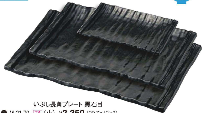
いぶし長角プレート 黒石目