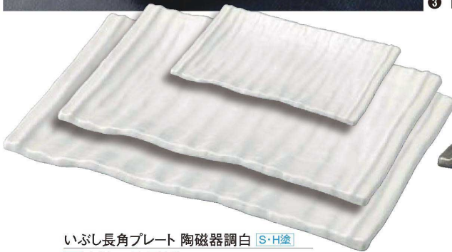
いぶし長角プレート 陶磁器調白 S・H塗