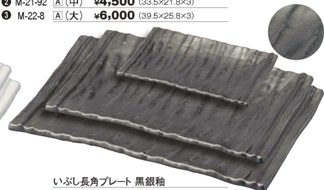
いぶし長角プレート 黒銀釉