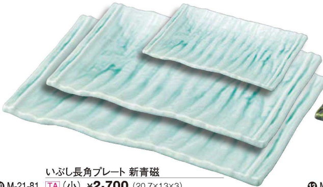
いぶし長角プレート 新青磁