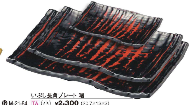
いぶし長角プレート 曙