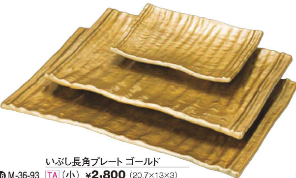
いぶし長角プレート ゴールド