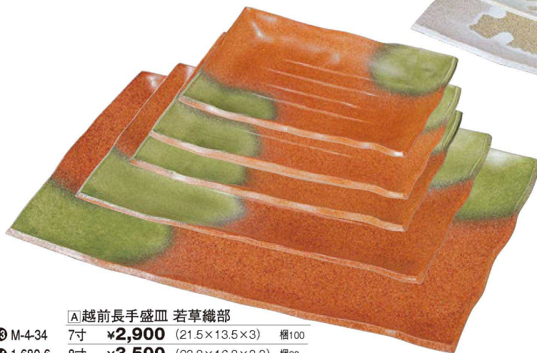
▲越前長手盛皿 若草織部