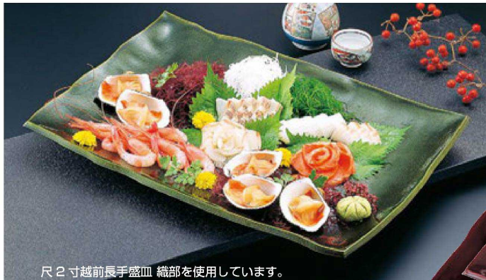
尺2寸越前長手盛皿 織部を使用しています。

陶器風に強化塗りを施しており、ハガレにくく、陶器に比べて軽いうえにワレにくく、グレードの高い商品です。非常に効率的で経済的です。