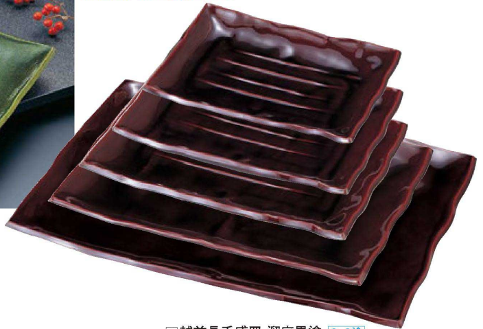
▲越前長手盛皿 溜底黒塗 S・S塗

陶器風に強化塗りを施しており、ハガレにくく、陶器に比べて軽いうえにワレにくく、グレードの高い商品です。非常に効率的で経済的です。