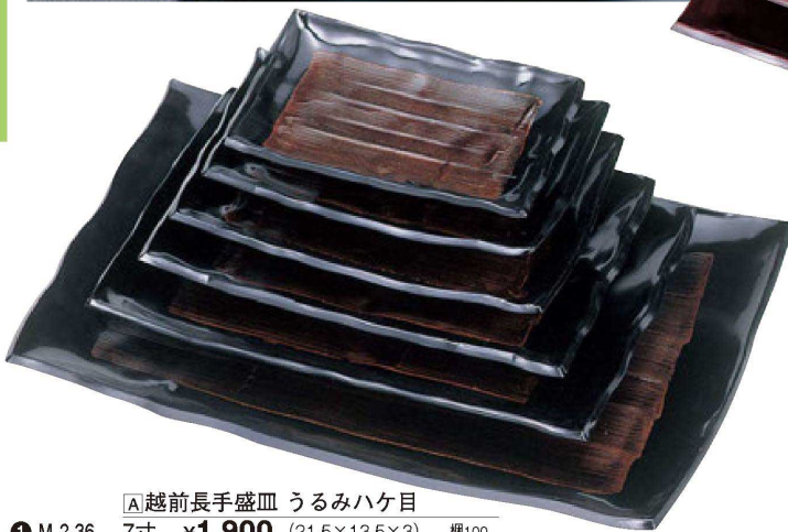
▲越前長手盛皿 うるみハケ目