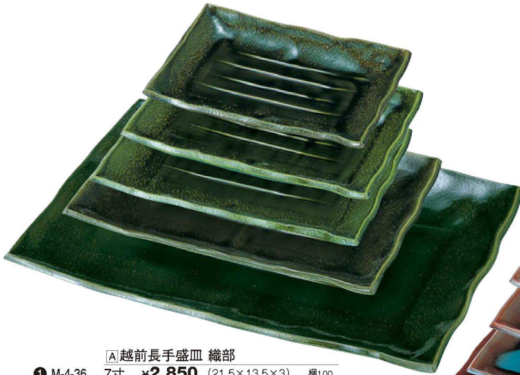
【A】越前長手盛皿 織部