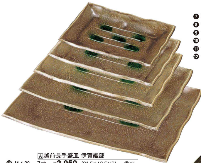
【A】越前長手盛皿 伊賀織部