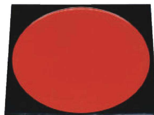
⑦ 1-78-10 A 円月会席盆 黒内朱 ¥2,800 (33.5×33.5×1) 梱50