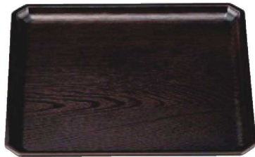
① A 正角木目隅切盆 溜 B-12-70 尺0寸 ¥2,000 (30×30×2) 梱60 B-12-71 尺1寸 ¥2,250 (33×33×2) 梱40