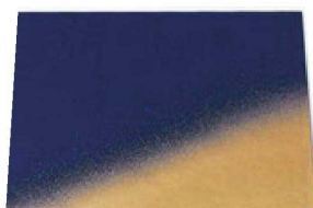
⑤ B-6-2 A 尺1寸角敷膳 紫金ボカシ ¥2,200 (32×32×0.5) 梱50