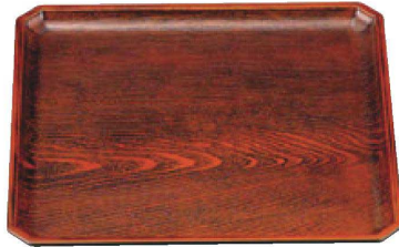
② A 正角木目隅切盆 栴 B-12-72 尺0寸 ¥3,050 (30×30×2) 梱60 B-12-73 尺1寸 ¥3,600 (33×33×2) 梱40