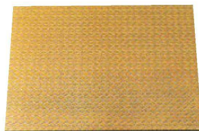
⑥ B-6-3 A 尺1寸角網代敷膳 金編み ¥2,250 (32×32×0.5) 梱50