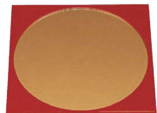
⑧ 1-78-11 A 円月会席盆 朱内金 ¥3,100 (33.5×33.5×1) 梱50