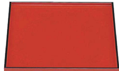
③ A 尺0寸角爪掛盆 朱天黒 B-2-56 ¥2,100 (30.5×30.5×1.5) 梱60