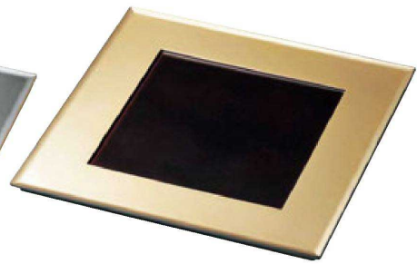
⑦ A 尺1寸角懐石プレート 溜/金煌 B-14-51 ¥5,350 (33.3×33.3×1.4) 梱40