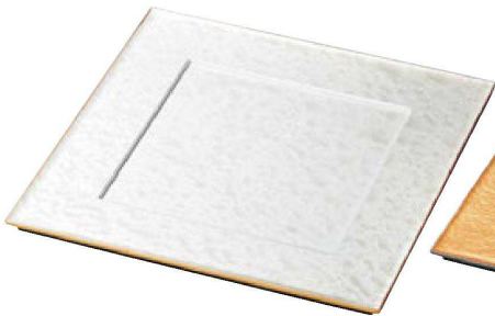
③ A 尺1寸角懐石プレート 白アクリル金 B-14-47 ¥4,250 (33.3×33.3×1.4) 梱40