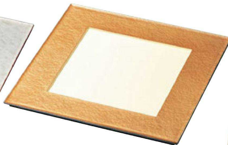
④ A 尺1寸角懐石プレート アイボリー/ブラウン雲流 B-14-48 ¥4,450 (33.3×33.3×1.4) 梱40