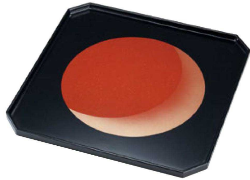
② A 隅切会席布目皿 紅月/裏乾漆塗 B-33-33A 尺1寸 ¥14,500 (33×33×1.7) 梱40