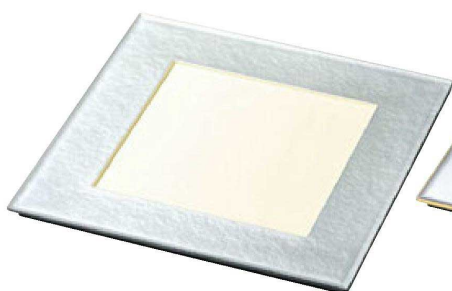
⑤ A 尺1寸角懐石プレート アイボリー/シルバー雲流 B-14-49 ¥4,450 (33.3×33.3×1.4) 梱40