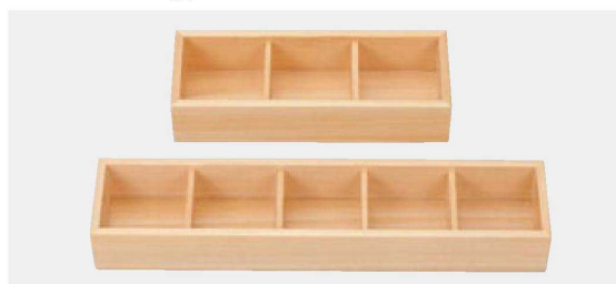
困スタック長手珍味箱