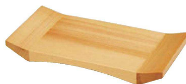
⑳ 困8寸白木両反盛皿 限定品