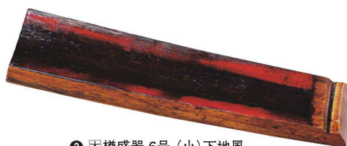
② 困樽盛器 6号 (小) 下地風 M-14-97 ¥32,500 (40.5×11×3)