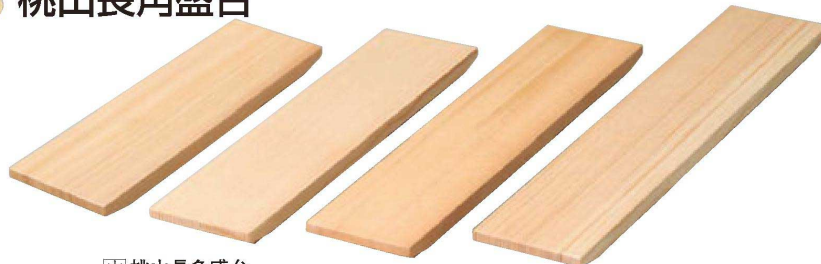
困 桃山長角盛台 ⑪ M-34-6 (ミニ) ¥3,500 (30×9×2.7) 欄60 ⑫ M-25-35 (小) ¥3,900 (36×9×2.7) 欄40 ⑬ M-25-36 (中) ¥5,000 (39×9×2.7) 欄30 ⑭ M-25-37 (大) ¥6,700 (45×9×2.7) 欄20 (桧)