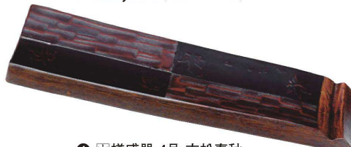
④ 困樽盛器 4号 市松春秋 M-14-99 ¥31,000 (40.5×11×3)