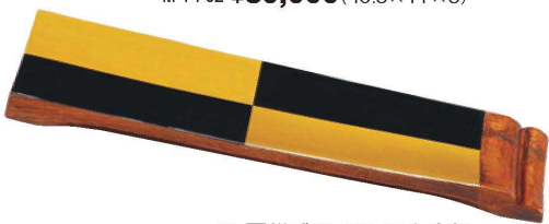
⑤ 困樽盛器 4号 黒金市松 M-21-28 ¥32,500 (40×12×3)