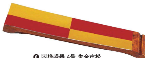
⑥ 困樽盛器 4号 朱金市松 M-21-29 ¥32,500 (40×12×3)