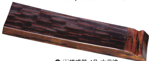
③ 困樽盛器 4号 古代塗 M-14-62 ¥30,000 (40.5×11×3)