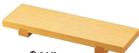
⑩ O-3-65 困木製長角特大マナ板 (2人用) ¥4,950 (34.8×11×3.5) 欄20