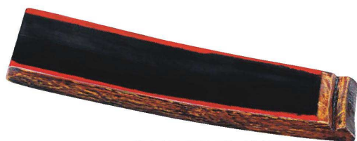
① 困樽盛器 4号 (小) 黒/朱 M-14-95 ¥28,500 (40.5×11×3)