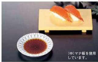
(中) マナ板を使用しています。