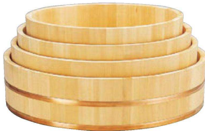
困さわら飯切 直送