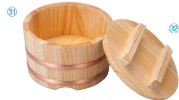
困さわら ちらし桶 15cm