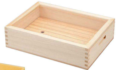
ネタケース (透明蓋) スノ子付