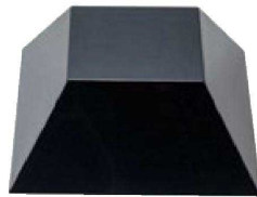
① M-39-18 困台形付台 黒(真塗) ¥14,000 (20.4×20.4×8) (天頂部11×11)