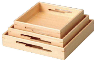
困桃山透かし箱 ⑪ M-25-38 (小) ¥5,500 (18.3×18.3×4.6) 梱50 ⑫ M-25-39 (中) ¥6,200 (21.3×21.3×4.6) 梱40 ⑬ M-25-40 (大) ¥6,800 (24.3×24.3×4.6) 梱30 (桧)