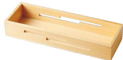
⑥ 1-728-5 困白木9寸長角透かし盛器 ¥6,000 (28×9×4.5) 梱40 (桧)