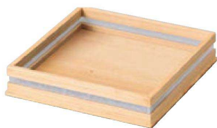
困安土正角盛器 ⑦ M-25-21 (小) ¥8,000 (20.5×20.5×4) 梱40 ⑧ M-25-23 (大) ¥9,100 (23.5×23.5×4) 梱30 (桧) (ワーロン)