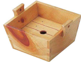
② M-13-27 困(小)手付つるべ盛器(節付) ¥8,000 (14.8×12.8×10) 梱50