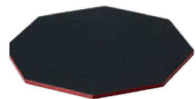
⑮ M-25-20 困安土八角盛器用目皿 朱/黒 ¥3,750 (20.5×20.5×0.5) 梱100