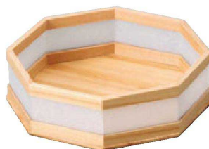
⑭ M-25-19 困安土八角盛器 ¥10,000 (22×20.8×6) 梱30 (桧) (ワーロン)