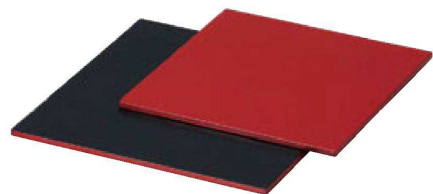
困安土正角盛器用目皿 朱/黒 ⑨ M-25-22 (小) ¥3,000 (18×18×0.5) 梱100 ⑩ M-25-24 (大) ¥3,600 (21.5×21.5×0.5) 梱100