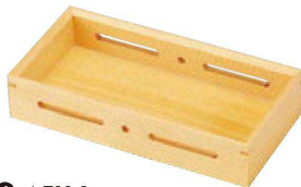
④ 1-729-3 困白木8寸長角透かし盛器 ¥5,400 (24×12×5) 梱30 (桧)