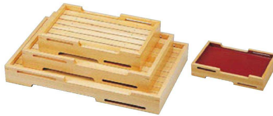
冨桧両面盛込 雲海