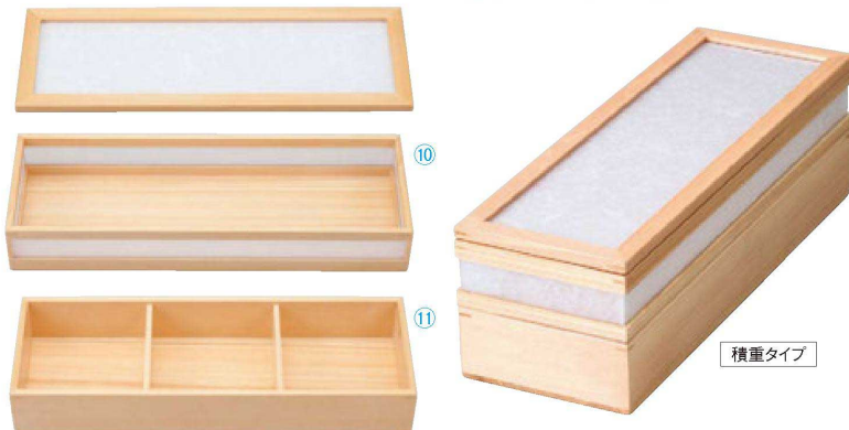
☐ 安土長角二段弁当(大)