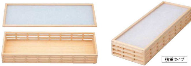
☐ 安土格子長角盛箱