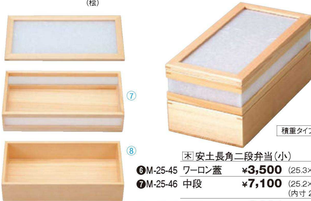
☐ 安土長角二段弁当(小)