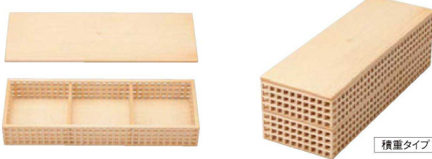
☐ 細目格子長角盛箱