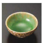
⑱ C-7-52 (1/9用) 陶イラホグリーン 丸千代口 有田焼 ¥1,400 (6.6φ×2.9)