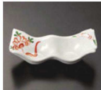
⑫ C-7-49 (2/9用) 陶万歴 二品盛 有田焼 ¥4,050 (14.5×6.1×4.3)