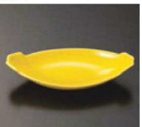
⑪ C-7-50 (3/9用) 陶黄釉 笹型小皿 有田焼 ¥1,950 (14.1×6.8×3)