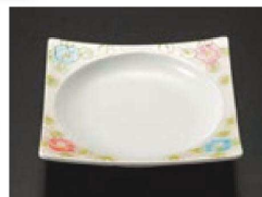
③ C-7-40 (4/9用) 陶ラスター山茶花 角丸皿 有田焼 ¥5,100 (15.6×15.5×3.8)