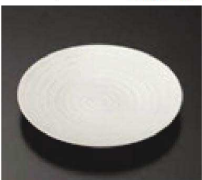
⑨ C-7-46 (4/9用) 陶一珍うず5寸 平皿 有田焼 ¥2,450 (15.4φ×1.8)