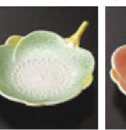
㉛ C-7-65 (1/9用) 陶花小皿 (小) ラスター彩緑 有田焼 ¥3,450 (8.5×7×2.1)