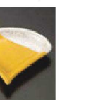
㉖ C-7-60 (1/9用) 陶掛分黄釉ラスター 扇型豆皿 有田焼 ¥2,750 (8.5×7.6×1.1)