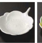
㉚ C-7-64 (1/9用) 陶花小皿 (小) 太白 有田焼 ¥1,800 (8.5×7×2.1)