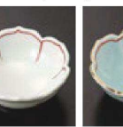
㉞ C-7-68 (1/9用) 陶線十草桔梗 測千代口 有田焼 ¥1,450 (7.3×7.3×2.9)