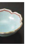
㉟ C-7-69 (1/9用) 陶赤金線桔梗 測千代口 有田焼 ¥1,600 (7.3×7.3×2.9)