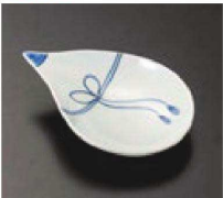
⑮ C-7-74 (風車用) 陶結び青ナス型皿 (中) 有田焼 ¥1,600 (13×9.8×3)