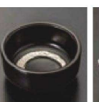
⑳ C-7-54 (1/9用) 陶新黒マットプラチナ 刷毛 小丸皿 有田焼 ¥1,700 (7.1φ×3.2)