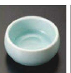
⑲ C-7-53 (1/9用) 陶青白磁厚 測丸子ヨク 有田焼 ¥1,550 (6.8φ×3)