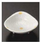
㉗ C-7-61 (1/9用) 陶白一珍大輪菊 ハマグリ珍珠 有田焼 ¥3,250 (8×7.2×3)