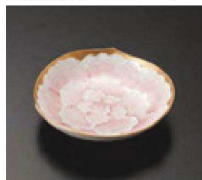
⑥ C-7-43 (4/9用) 陶金ピンク牡丹 輪花皿 有田焼 ¥4,900 (14.4×14.4×3.3)