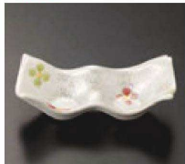
⑬ C-7-48 (2/9用) 陶ラスター小花散 二品盛 有田焼 ¥4,300 (14.5×6.1×4.3)