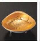
㉘ C-7-62 (1/9用) 陶金彩竹林 ハマグリ珍珠 有田焼 ¥4,750 (8×7.2×3)