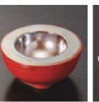
㉙ C-7-63 (1/9用) 陶朱塗南蛮パール 丸々小付 有田焼 ¥3,000 (7φ×3.2)