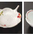
㉝ C-7-67 (1/9用) 陶花小皿 (小) ラスター彩小花 有田焼 ¥3,450 (8.5×7×2.1)