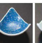
㉒ C-7-56 (1/9用) 陶ゴス白吹 測上り珍珠 有田焼 ¥3,000 (7.5×7.5×3.3)