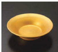
⑦ C-7-44 (4/9用) 陶梨地金彩 アーチボール 有田焼 ¥3,150 (14.7φ×3.6)