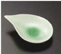
⑭ C-7-73 (風車用) 陶ヒワビードロ ナス型皿 (中) 有田焼 ¥1,400 (13×9.8×3)