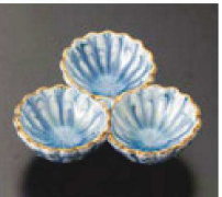
⑰ C-7-72 (風車用) 陶吹墨青磁淵金 三宝菊珍珠 有田焼 ¥3,300 (10.4×10.4×3.1)