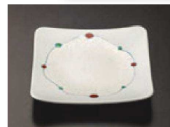
④ C-7-41 (4/9用) 陶二色玉つなぎ 虹彩角皿 有田焼 ¥4,600 (15.1×15.1×2.1)