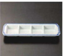
⑩ C-7-47 (3/9用) 陶ともえ 4品盛 有田焼 ¥3,100 (23×7.6×2.3)