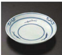
⑧ C-7-45 (4/9用) 陶松葉5寸 深皿 有田焼 ¥2,450 (15.4φ×2.7)