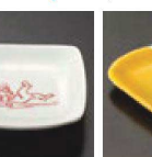
㉕ C-7-59 (1/9用) 陶高山寺角豆皿 赤 有田焼 ¥1,400 (7.1×7.1×1.6)