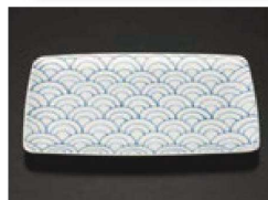
② C-7-39 (6/9用) 陶染付青海波 パンプレート 有田焼 ¥7,000 (21.4×14.9×1.3)