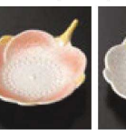
㉜ C-7-66 (1/9用) 陶花小皿 (小) ラスター彩赤 有田焼 ¥3,450 (8.5×7×2.1)