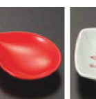
㉔ C-7-58 (1/9用) 陶赤釉ナス型皿 (小) 有田焼 ¥900 (9×6×2.5)