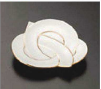
⑯ C-7-75 (風車用) 陶太白金線むすび 小皿 有田焼 ¥2,700 (10.9×10.3×2.8)