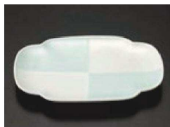
① C-7-38 (6/9用) 陶青磁市松 木甲焼皿 有田焼 ¥3,150 (21.4×14.6×2)