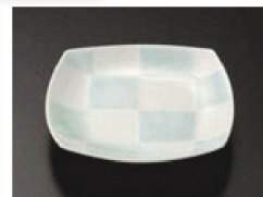
⑤ C-7-42 (4/9用) 陶一珍格子6寸 角皿 有田焼 ¥2,450 (15.5×15.5×3)