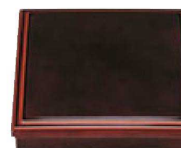
⑦ A D X8.5寸松花堂 1-296-2 外溜内漆調黒塗 (仕切別) S-S塗 ¥4,500 (26×26×6.5) 極40

S-S塗 ソフトでキズに対して復元力があり、汚れが附着しにくく、丈夫で器の艶も長く保ちます。