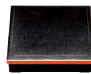
⑤ A 8.5寸新布目松花堂 1-245-10 黒淵朱 (仕切別) ¥1,850 (25.6×25.6×6.3) 極40