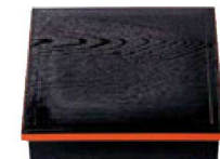
④ A 8.5寸木目松花堂 1-245-7 黒淵朱内塗無 (仕切別) ¥1,650 (26×26×6) 極40