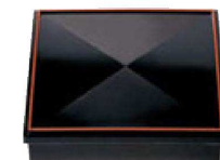
⑥ A 8.5寸キング松花堂 1-294-1 黒天朱 (仕切別) ¥2,550 (25.9×25.9×6.8) 極40