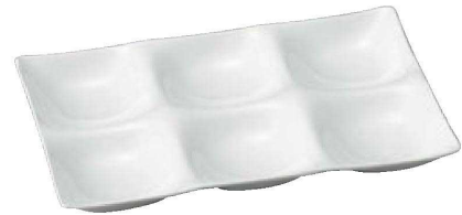
① A シックスホールプレート M-22-55 陶磁器調白 S・H 塗 ¥2,400 (25.6×17×2.7) 欄80