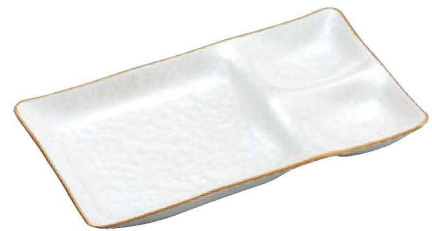
⑤ A ツーコンビプレート M-18-5 白アクリル 測金 ¥2,400 (25.5×17×2.4) 欄80

・他のプレートは350・351頁参照 シックスホールプレート・ツーコンビプレート・ ワンコンビプレートが入ります。