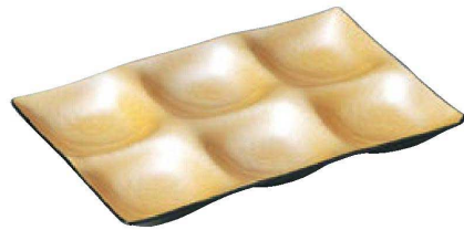
② A シックスホールプレート M-19-22 ベージュ雲流 ¥2,400 (25.6×17×2.7) 欄80