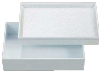
③ C-7-25 A 9寸長手花筐松花堂 白アクリル 内白 蓋 ¥3,850 (27×18.5×3.7)