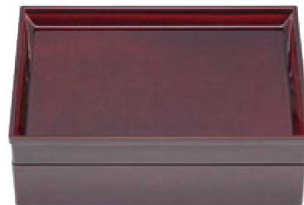
⑦ C-7-28 A 9寸長手花筐松花堂 溜 内黒塗 蓋 ¥2,950 (27×18.5×3.7)