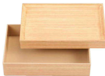
④ C-7-26 A 9寸長手花筐松花堂 ラバーウッド 内クリーム 蓋 ¥3,900 (27×18.5×3.7)