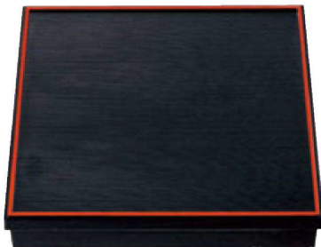
① A 尺3寸角千筋会席松花堂 1-256-1 黒天朱内黒塗(仕切別) ¥5,900(38×38×7.2) 横20