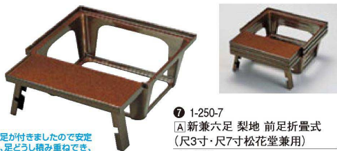
⑦ 1-250-7 A 新兼六足 梨地 前足折畳式 (尺3寸・尺7寸松花堂兼用) ¥5,400(36.7×41.7×15) 横30

●前面に足が付きましたので安定性があり、足どうし積み重ねでき、前足2本は折畳みができます。