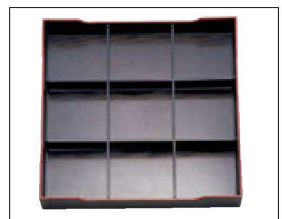
④ A 尺3寸角松花堂用 1-252-3 A仕切 ¥1,400