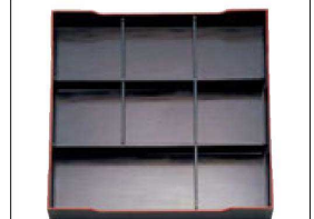
⑤ A 尺3寸角松花堂用 1-252-4 B仕切 ¥1,360