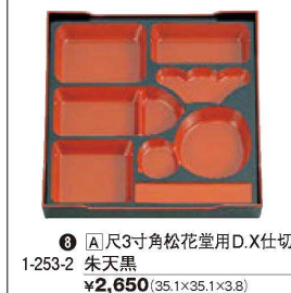
⑧ A 尺3寸角松花堂用 D.X仕切 1-253-2 朱天黒 ¥2,650(35.1×35.1×3.8)

●前面に足が付きましたので安定性があり、足どうし積み重ねでき、前足2本は折畳みができます。