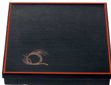
② A 尺3寸角千筋会席松花堂 1-256-2 黒天朱柳結び内黒塗(仕切別) ¥6,250(38×38×7.2) 横20