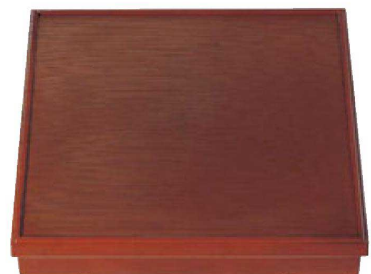
③ A 尺3寸角千筋会席松花堂 1-256-3 溜内黒塗(仕切別) ¥6,850(38×38×7.2) 横20