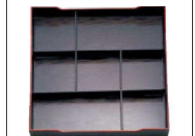
⑥ A 尺3寸角松花堂用 1-254-4 C仕切 ¥1,010