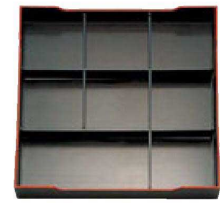
⑤ A尺3寸角松花堂用 1-252-4 B仕切 ¥1,360