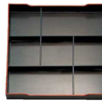
⑥ A尺3寸角松花堂用 1-254-4 C仕切 ¥1,010