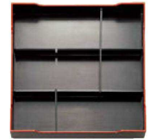
⑦ A尺3寸角松花堂用 1-252-5 D仕切 ¥980