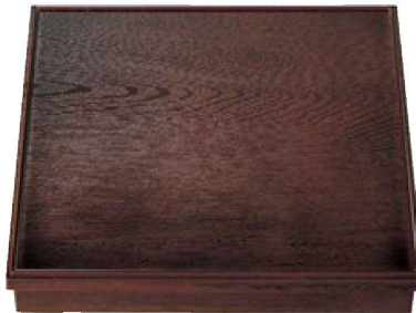
② A尺3寸角木目松花堂 溜(仕切別) 1-252-2 ¥6,400 (38×38×6.7) 横20