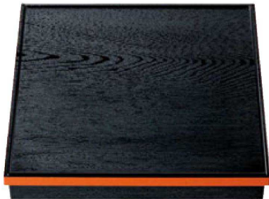
① A尺3寸角木目松花堂 黒淵朱(仕切別) 1-252-1 ¥5,500 (38×38×6.7) 横20