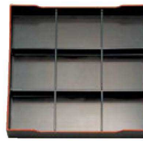
④ A尺3寸角松花堂用 1-252-3 A仕切 ¥1,400