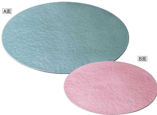
① A 両面小判敷膳 B-24-46 グリーン雲流/ピンク雲流 ¥4,000 (34×27×0.3) 梱40