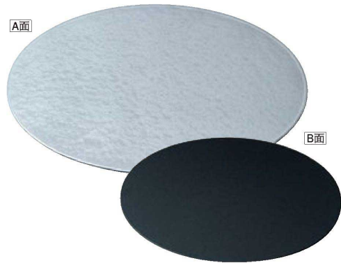
② A 両面小判敷膳 B-24-47 シルバー雲流/黒石目 ¥3,400 (34×27×0.3) 梱40