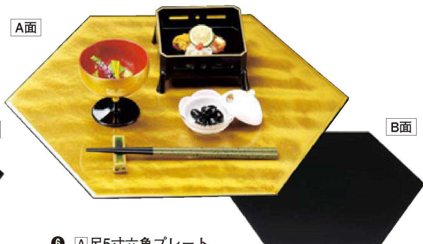
⑥ A 尺5寸六角プレート B-10-64 金雲流/黒塗 ¥3,800 (45×39×0.4) 梱30