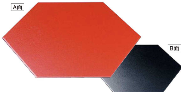
⑤ A 尺5寸六角プレート B-10-63 朱石目/黒石目 ¥3,750 (45×39×0.4) 梱30