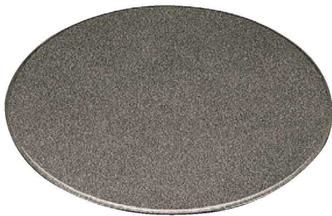
③ A 丸マット オーシャンパール B-2-82 7寸 ¥1,900 (21.2φ×0.3) 梱60 B-2-83 8寸 ¥2,250 (24.7φ×0.3) 梱60 B-2-84 尺0寸 ¥2,800 (30.3φ×0.3) 梱60 B-34-92 尺2寸 ¥3,700 (36φ×0.3) 梱40