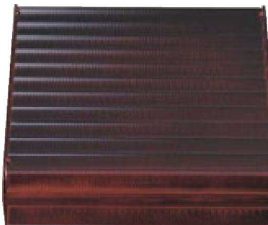
⑨ 1-298-10 A 8.5寸竹目松花堂 溜内黒塗(仕切別) ¥3,600 (25×25×7.8) 梱40