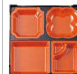
⑯ 1-245-16 A 8.5寸用 D.X焼石仕切 朱天黒 ¥1,250 (23.5×23.5×4) 梱60