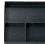
⑧ C-1-91C A 8.5寸松花堂用 T字仕切(低型用) ¥400 (23.2×11.7×3.9)