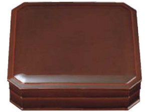
④ C-1-96 A 8.5寸隅切松花堂 溜内黒塗(仕切別) ¥3,900 (25.3×25.3×7.3) 梱40