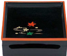
⑤ 1-298-2 A 8.5寸新花筐松花堂 黒天朱春秋内黒塗(仕切別) ¥4,500 (25×25×9.4) 梱40