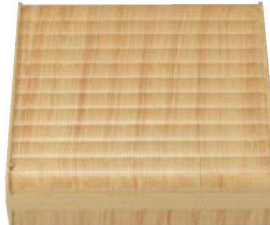
⑩ C-7-82 A 8.5寸竹目松花堂 クリーム刷毛塗内塗(仕切別) ¥3,800 (25×25×7.8) 梱40