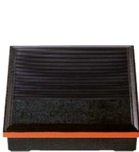
① 1-297-2 A 8.5寸角布目千筋松花堂 黒淵朱(仕切別) ¥1,800 (25.8×25.8×6.9) 梱40

8.5寸角布目千筋松花堂 8.5寸角会席松花堂 8.5寸角あじろ松花堂 8.5寸隅切松花堂