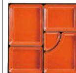
⑮ C-1-68 A 8.5寸用 新セット仕切 朱天黒 ¥1,150 (23.4×23.4×3.8) 梱60