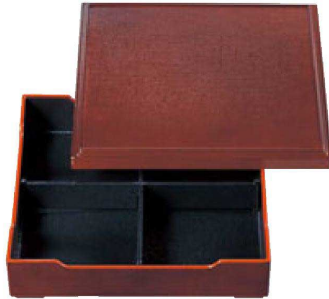
② 1-293-3 A 8.5寸角会席松花堂 溜布目(仕切別) ¥2,900 (25.5×25.5×6.5) 梱40 (画像は十字仕切使用)