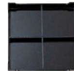
⑦ 1-298-3 A 8.5寸松花堂用 新十字仕切 黒 ¥520 ◎◎◎対応 (23.2×23.2×3.9)