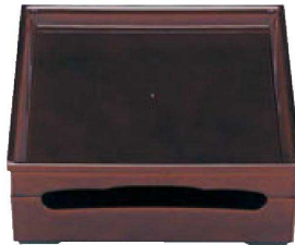
⑥ 1-298-1 A 8.5寸新花筐松花堂 溜内溜塗(仕切別) ¥5,100 (25×25×9.4) 梱40