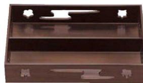
② 1-304-2 A 9寸春日透かし松花堂 溜 ¥4,000 (28×17.9×5.6) 櫃40