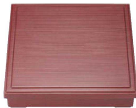
⑬ C-7-81 A 尺0寸角雅松花堂 内外ウルミ 蓋のみ ¥1,700 (28.4×28.4×1.8) 写真は親・蓋です