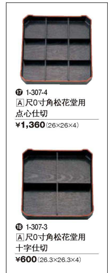
⑰ 1-307-4 A 尺0寸角松花堂用 点心仕切 ¥1,360 (26×26×4)