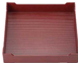
⑭ C-7-80 A 尺0寸角雅松花堂 内外ウルミ 親のみ ¥1,900 (27.4×27.4×5.8) (内寸26.3×26.3)