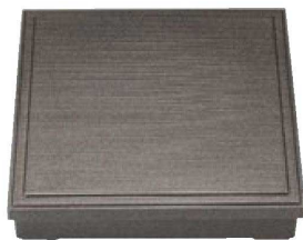
⑪ C-7-79 A 尺0寸角雅松花堂 内外銀鱗塗 蓋のみ ¥1,900 (28.4×28.4×1.8) 写真は親・蓋です