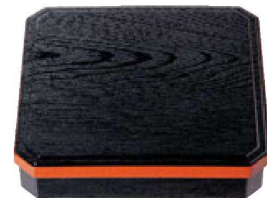
⑯ 1-307-1 A 尺0寸角隅切松花堂 黒瀾朱(仕切別) ¥3,500 (28.6×28.6×6.3) 櫃20