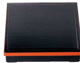
⑮ 1-307-2 A 尺0寸角千筋松花堂 黒瀾朱 本体Bタイプ(仕切別) ¥3,300 (28.3×28.3×6.4) 櫃20