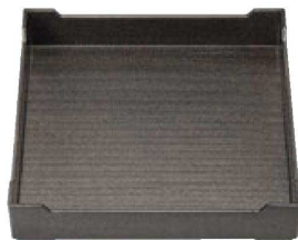
⑫ C-7-78 A 尺0寸角雅松花堂 内外銀鱗塗 親のみ ¥2,000 (27.4×27.4×5.8) (内寸26.3×26.3)