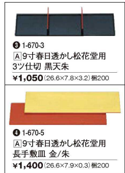
③ 1-670-3 A 9寸春日透かし松花堂用 3ツ仕切 黒天朱 ¥1,050 (26.6×7.8×3.2) 櫃200