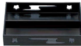
① 1-304-1 A 9寸春日透かし松花堂 黒 ¥3,400 (28×17.9×5.6) 櫃40