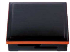
㉕ 1-308-2 A 7寸透かし松花堂 黒瀾朱内黒塗(仕切別) ¥3,400 (22.3×22.3×6.5) 網40