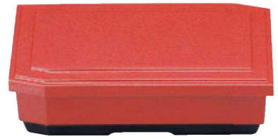
ST超耐熱7寸ハーフ松花堂 タタキ朱 ③ C-3-89 親 ¥1,800 (19.9×11.8×5.3) ④ C-3-90 蓋 ¥1,450 (21×12.9×1.6)