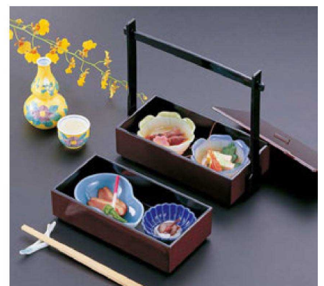
㉚ 1-387-4 蓋のみ ¥1,300 (21.2×10.5×1.5) 網100 ㉛ 1-387-5 上段 ¥1,800 (21.2×10.5×5.6) 網50 ㉜ 1-387-6 下段(持ち手付) ¥2,950 (25.3×10.6×22) 網50