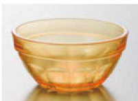
⑪ M-37-72 PC 重ね小鉢(小) アンバー ¥660 (9.7φ×3.8) 網200