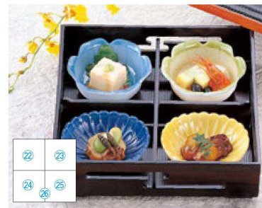
⑳ 1-338-9 M 花鉢 青磁 ¥1,200 (9.1×9.1×3.7) ㉑ 1-338-10 M 花鉢 オレンジグリーン ¥1,400 (9.1×9.1×3.7) ㉒ 1-338-14 M 長菊鉢 瑠璃 ¥1,200 (9.2×7.9×3) ㉓ 1-338-13 M 長菊鉢 黄 ¥1,200 (9.2×7.9×3) ㉔ 1-308-1E A 7寸松花堂用十字仕切 ¥500 (20×20×3.5)