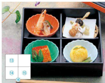
⑬ 1-338-3 A 3寸菊型鉢 柿釉 ¥700 (9.1φ×3.3) ⑭ 1-338-4 A 3寸菊型鉢 ヒワググリーン ¥700 (9.1φ×3.3) ⑮ 1-338-2 A 3寸菊型鉢 青磁 ¥700 (9.1φ×3.3) ⑯ 1-308-1E A 7寸松花堂用十字仕切 ¥500 (20×20×3.5)