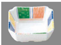
⑨ C-4-76 M 3寸隅切角鉢 彩り ¥1,200 (9.3×9.3×3.8) 網200