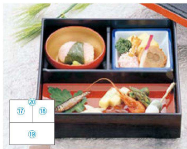
⑰ 1-338-18 A 3.3寸丸鉢 朱内金 ¥950 (9.7φ×3.8) ⑱ 1-338-25 陶 3寸角鉢 瀾紺 ¥1,600 (9.1×9.1×3) ㉖ 1-305-1H A 7寸用吹上げ長角皿 朱 ¥1,100 (20×9.8×1) ㉗ 1-308-10 A 7寸松花堂用T字仕切 ¥500 (20×12×3.5)