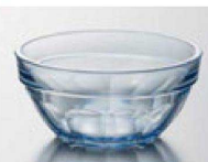
⑩ M-37-71 PC 重ね小鉢(小) マリン ¥660 (9.7φ×3.8) 網200