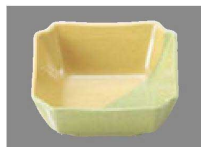
⑧ C-4-75 M 3寸隅切角鉢 ツートン ¥1,150 (9.3×9.3×3.8) 網200