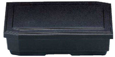
ST超耐熱7寸ハーフ松花堂 溜石目 ① C-3-87 親 ¥1,800 (19.9×11.8×5.3) ② C-3-88 蓋 ¥1,450 (21×12.9×1.6)