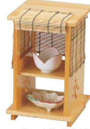
⑥ 困近江路すだれ付(本体のみ) 1-317-7 ¥18,500 (15×15×23) 梱20 A 團 チュールリップ珍珠ピンク ¥1,900 B