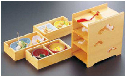
② 困3段引き出し弁当(本体のみ) 1-316-2 ¥23,500 (21×12.5×20.5) 梱20 A 團 3寸角鉢 青磁 ¥1,400 B C M ひさご鉢 青磁 ¥1,350 D 團 チュールリップ珍珠ピンク ¥1,900 E A 2.6寸丸鉢 黒内朱 ¥480 F A 2.6寸丸鉢 朱内金 ¥850