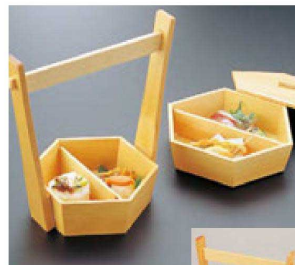
⑤ 1-316-5 困手桶2段弁当 ¥24,000 (25.2×20.7×26) 梱10