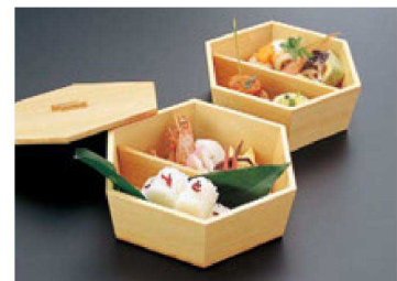
⑯ 1-316-8 困六角弁当 ¥15,000 (20.7×17.8×13) 梱20