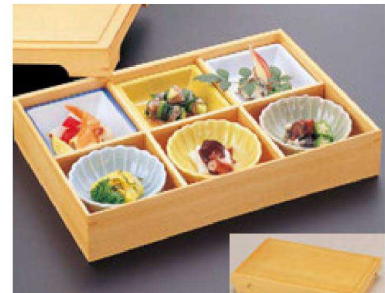
③ 困山海弁当(小)(本体のみ) 1-317-9 ¥19,000 (32.2×22×6) 梱20 A 團 3寸角鉢 測紺 ¥1,600 B 團 3寸角鉢 黄 ¥1,950 C 團 3寸角鉢 青磁 ¥1,400 D 團 3寸菊型千代久 青磁 ¥1,400 E 團 3寸菊型千代久 黄 ¥1,400 F 團 3寸菊型千代久 ヒワ ¥1,400