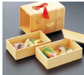
⑩ 1-316-6 困弥生弁当 ウグイス ¥19,500 (18×11.2×12.8) 梱20