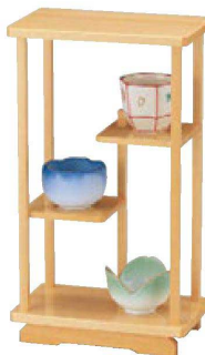
⑪ 困白木とまり木(本体のみ) 1-317-6 ¥8,300 (17×10×30) 梱20 A B C 團 チュールリップ珍珠 グリーン ¥1,900