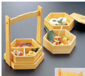
⑨ 1-316-3 困六角手提げ弁当 ¥24,000 (20.1×20×26) 梱10