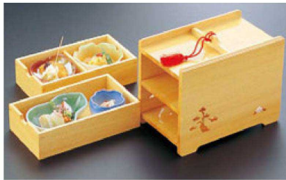
① 困2段引き出し弁当(本体のみ) 1-316-1 ¥21,500 (21×12.5×18) 梱20 A M この葉鉢 縹部 ¥1,400 B M 花鉢 オレンジグリーン ¥1,400 C M ひさご鉢 グリーン ¥1,350 D