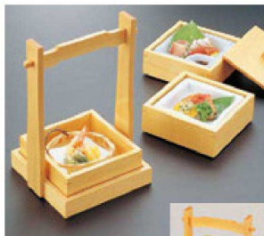
④ 困手付正角弁当(本体のみ) 1-316-4 ¥22,000 (20×16×26) 梱10 A B 團 ゴスー珍仕切付鉢 ¥2,400 C 竹 丸かご ¥1,000