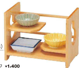
⑭ 1-317-5 困清原(本体のみ) ¥15,500 (24×15×18) 梱20 A 團 3寸菊型千代久 ヒワ ¥1,400 B 團 3寸菊型千代久 黄 ¥1,400 C 團 3寸角鉢 測紺 ¥1,600