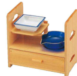
⑬ 1-317-4 困足利弁当 ¥16,000 (23×14×21.2) 梱10 A 團 3寸角鉢 測紺 ¥1,600 B