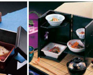
⑮ 1-321-2 困3段大徳透かし開き弁当 黒(オプション別売) ¥24,000 (15.7×15.7×24.7) 横10 A B C 陶角鉢 赤絵 ¥3,000