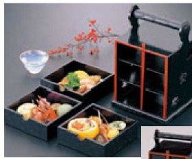
⑥ 1-320-11 困(小)手提3ツ引野立弁当 ¥18,200 (15×16×24.5) 横20