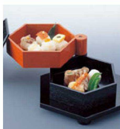
⑯ 1-321-13 困(大)台付 六角弁当 ¥22,500 (23.8×20.7×12.5) 横20