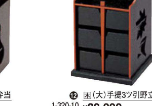
⑫ 困(大)手提3ツ引野立弁当 1-320-10 ¥20,000 (17.5×16.2×25) 横10