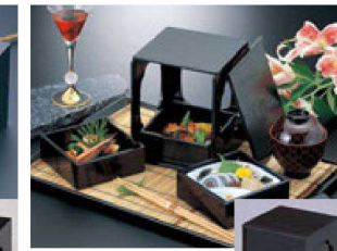
⑧ 1-320-16 困野立て重箱(オプション別) ¥16,000 (15×15×18) 横20 陶扇型タレ付鉢 松 限定品 ¥550