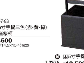
⑩ 困5寸手提3段重 黒木目 1-320-5 ¥12,500 (15×17.9×19.6) 横20