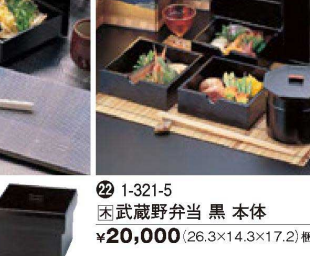
㉒ 1-321-5 困武蔵野弁当 黒 本体 ¥20,000 (26.3×14.3×17.2) 横20