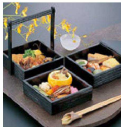
⑬ 1-320-4 困5寸手提3段重 黒千筋 ¥14,500 (15×17.9×19.6) 横20