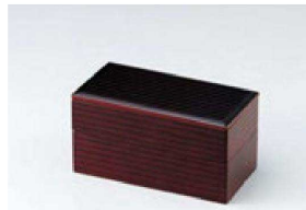
② C-4-71 困長手カンナ目弁当 溜内朱2段 ¥10,000 (17×8.8×9)