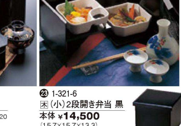
㉓ 1-321-6 困(小)2段開き弁当 黒 本体 ¥14,500 (15.7×15.7×13.3)