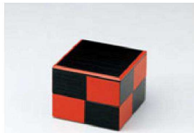
① C-4-70 困4寸2段黒市松内朱弁当 T字仕切付 ¥11,000 (11.6×11.6×9)