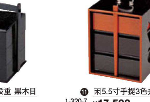
⑪ 困5.5寸手提3色弁当 1-320-7 ¥17,500 (17×17.3×22) 横20