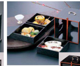
⑦ 1-320-15 困手提野立3段重(金具付) ¥16,500 (18.5×19×17) 横20