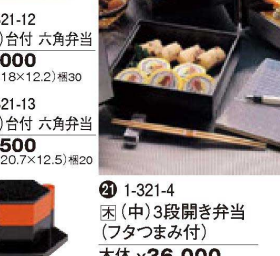
㉑ 1-321-4 困(中)3段開き弁当 (フタつまみ付) 本体 ¥36,000 (19.5×19.5×15) 横10