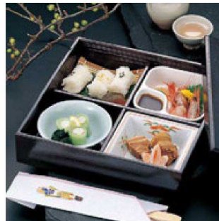
③ 1-320-3 困8.5寸松花堂 外溜布目内筋 オヤフタ 十字仕切付 ¥12,800 (26.5×26.5×6.3) 横20