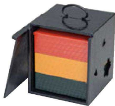
⑨ C-7-83 困4.6寸手提三色(赤・黄・緑) 弁当桜柄 ¥20,500 (13.8×14.5×15.4) 横20