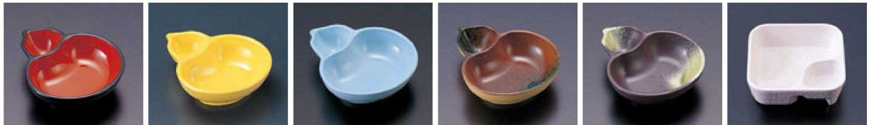
㉛ 1-326-16 TA ひさごタレ付鉢 黒内朱天黒 ¥950(12.8×10.8×3.5) 欄200 ㉜ C-2-56 TA ひさごタレ付鉢 黄 ¥1,000(12.8×10.8×3.5) 欄200 ㉝ 1-326-18 TA ひさごタレ付鉢 青磁 ¥1,000(12.8×10.8×3.5) 欄200 ㉞ 1-326-19 TA ひさごタレ付鉢 茶グリーン吹 ¥1,200(12.8×10.8×3.5) 欄200 ㉟ 1-326-20 TA ひさごタレ付鉢 岩織部 ¥1,300(12.8×10.8×3.5) 欄200 ㊱ C-6-10 M タレ付角鉢 白 ¥2,400(11.1×11.1×3.5) 欄100