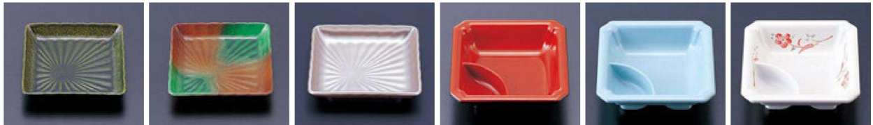
⑬ 1-325-19 A 菊角皿 織部 ¥1,200(11.3×11.3×2) 欄200 ⑭ 1-325-20 A 菊角皿 若草織部 ¥1,300(11.3×11.3×2) 欄200 ⑮ C-1-40 A 菊角皿 銀塗 ¥1,800(11.3×11.3×2) 欄200 ⑯ 1-326-1 TA 隅切タレ付角鉢 黒内朱 ¥1,000(11.3×11.3×3.5) 欄200 ⑰ 1-326-2 TA 隅切タレ付角鉢 青磁 ¥1,000(11.3×11.3×3.5) 欄200 ⑱ 1-326-3 TA 隅切タレ付角鉢 赤絵 ¥1,950(11.3×11.3×3.5) 欄200