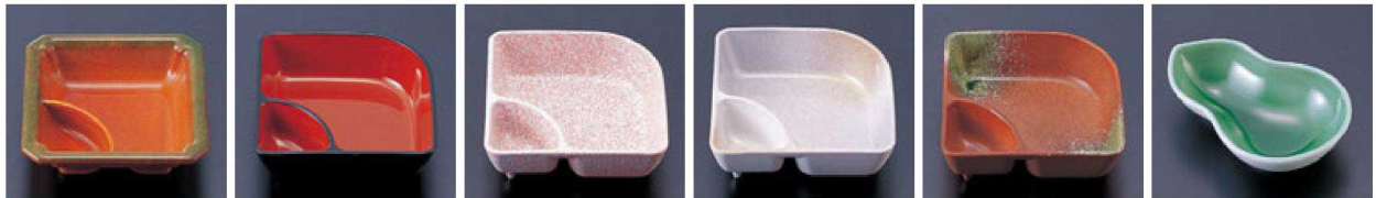
⑲ 1-326-4 TA 隅切タレ付角鉢 柿釉 ¥1,400(11.3×11.3×3.5) 欄200 ⑳ 1-326-5 A 扇型タレ付鉢 黒内朱天黒 ¥850(11.1×11.1×3.7) 欄200 ㉑ 1-326-6 A 扇型タレ付鉢 桜志野 ¥1,300(11.1×11.1×3.7) 欄200 ㉒ 1-326-7 A 扇型タレ付鉢 金銀パール ¥1,200(11.1×11.1×3.7) 欄200 ㉓ 1-326-8 A 扇型タレ付鉢 若草織部 ¥1,400(11.1×11.1×3.7) 欄200 ㉔ 1-326-9 M ひさご鉢 グリーン ¥1,350(12.8×8.7×3.3) 欄200