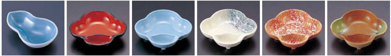
㉕ 1-326-10 M ひさご鉢 青磁 ¥1,350(12.8×8.7×3.3) 欄200 ㉖ 1-326-11 TA タレ付梅型鉢 黒内朱天黒 ¥850(13.3×11.8×3.5) 欄200 ㉗ 1-326-12 TA タレ付梅型鉢 青磁 ¥900(13.3×11.8×3.5) 欄200 ㉘ 1-326-13 TA タレ付梅型鉢 志野 ¥1,200(13.3×11.8×3.5) 欄200 ㉙ 1-326-14 TA タレ付梅型鉢 赤志野 ¥1,100(13.3×11.8×3.5) 欄200 ㉚ 1-326-15 TA タレ付梅型鉢 若草織部 ¥1,300(13.3×11.8×3.5) 欄200