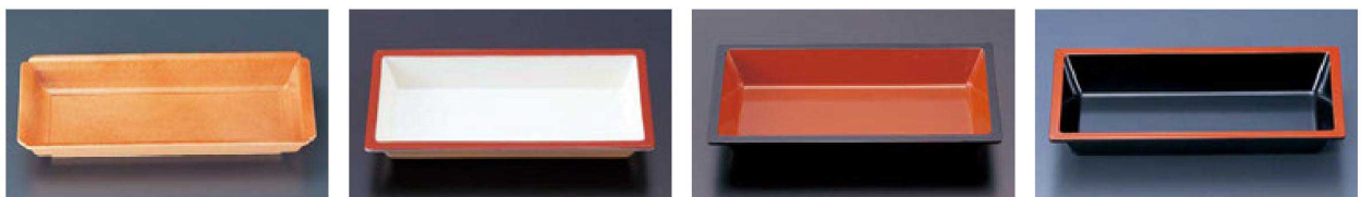
㉚ TA 若狭長角皿 茶しぶき C-2-98 ¥1,500 (23.2×11×3.4) 横100 ㉛ M 白メラミン長角鉢 アイボリー天朱 1-334-5 ¥1,500 (22.3×11.1×3.2) 横100 ㉜ A 長角鉢 朱天黒 1-334-7 ¥1,200 (23.6×11.6×3.8) 横100 ㉝ A 長角鉢 黒天朱 C-2-99 ¥1,200 (23.6×11.6×3.8) 横100