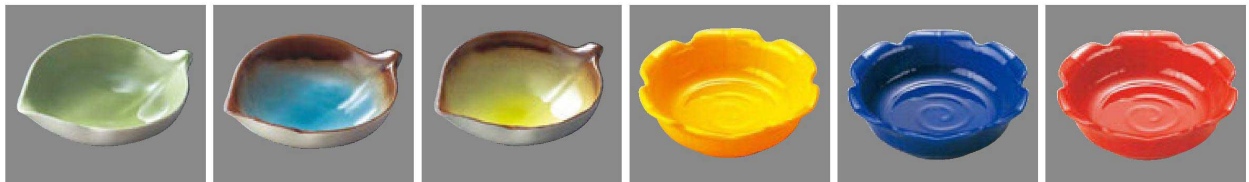
⑦ C-3-84 TA ABS このは鉢(大) グリーン ¥1,100(13×10.5×3.4) 横200 ⑧ C-3-85 TA ABS このは鉢(大) 青磁 ¥1,250(13×10.5×3.4) 横200 ⑨ C-3-86 TA ABS このは鉢(大) 織部 ¥1,250(13×10.5×3.4) 横200 ⑩ C-4-31 AC アクリル 花鉢(大) 黄 ¥700(11.3φ×3.6) 横200 ⑪ C-4-32 AC アクリル 花鉢(大) 瑠璃 ¥700(11.3φ×3.6) 横200 ⑫ C-4-33 AC アクリル 花鉢(大) 朱 ¥700(11.3φ×3.6) 横200