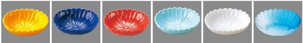
⑲ C-4-37 AC アクリル 長菊鉢(大) 黄 ¥700(11.3×9.7×3.8) 横200 ⑳ C-4-38 AC アクリル 長菊鉢(大) 瑠璃 ¥700(11.3×9.7×3.8) 横200 ㉑ C-4-39 AC アクリル 長菊鉢(大) 朱 ¥700(11.3×9.7×3.8) 横200 ㉒ C-4-40 AC アクリル 長菊鉢(大) 青磁 ¥700(11.3×9.7×3.8) 横200 ㉓ C-4-41 AC アクリル 長菊鉢(大) 白パール H.C塗 ¥1,000(11.3×9.7×3.8) 横200 ㉔ C-4-42 AC アクリル 長菊鉢(大) 淡雪吹ブルー ¥1,000(11.3×9.7×3.8) 横200