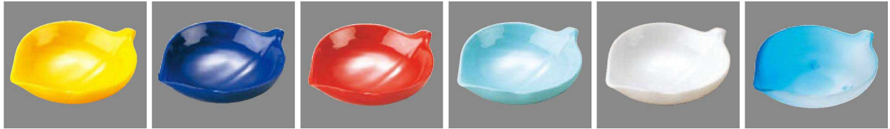
① C-4-25 AC アクリル このは鉢(大) 黄 ¥700(13×10.5×3.4) 横200 ② C-4-26 AC アクリル このは鉢(大) 瑠璃 ¥700(13×10.5×3.4) 横200 ③ C-4-27 AC アクリル このは鉢(大) 朱 ¥700(13×10.5×3.4) 横200 ④ C-4-28 AC アクリル このは鉢(大) 青磁 ¥700(13×10.5×3.4) 横200 ⑤ C-4-29 AC アクリル このは鉢(大) 白パール H.C塗 ¥1,000(13×10.5×3.4) 横200 ⑥ C-4-30 AC アクリル このは鉢(大) 淡雪吹ブルー ¥1,000(13×10.5×3.4) 横200