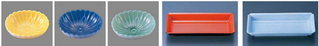
㉕ C-3-78 TA ABS 長菊鉢(大) 黄 ¥1,100(11.3×9.7×3.8) 横200 ㉖ C-3-79 TA ABS 長菊鉢(大) 瑠璃 ¥1,100(11.3×9.7×3.8) 横200 ㉗ C-3-80 TA ABS 長菊鉢(大) グリーン ¥1,100(11.3×9.7×3.8) 横200 ㉘ TA 若狭長角皿 外黒内朱 C-2-96 ¥1,250 (23.2×11×3.4) 横100 ㉙ TA 若狭長角皿 青磁 C-2-97 ¥1,550 (23.2×11×3.4) 横100