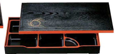
⑧ [A] 尺7寸長手会席松花堂 1-260-2 黒木目淵朱柳結び内黒塗 (仕切別) ¥7,700 (50.3×26×7) 櫃20