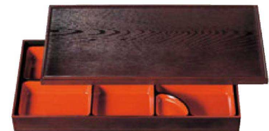
⑥ [A] 新尺7寸長手木目松花堂 1-258-2 溜 (仕切別) ¥7,500 (50.3×26.1×6.5) 櫃20