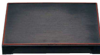
① [A] 尺5寸長手御膳千筋松花堂 1-342-1 黒天朱 (D.X仕切付) ¥10,500 (45.7×33.8×7) 櫃10