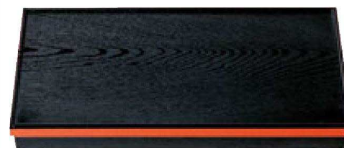
⑤ [A] 新尺7寸長手木目松花堂 1-258-1 黒淵朱 (仕切別) ¥6,200 (50.3×26.1×6.5) 櫃20