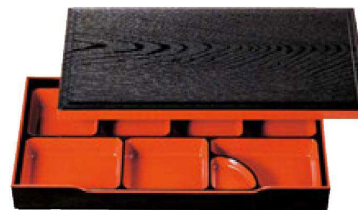
⑦ [A] 尺7寸長手会席松花堂 1-260-1 黒木目淵朱内黒塗 (仕切別) ¥7,400 (50.3×26×7) 櫃20