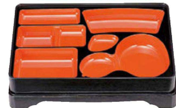
④ [A] 新尺5寸箱膳用 D.X仕切 朱天黒 ¥3,500 (43.3×30.3×4.2) 櫃20