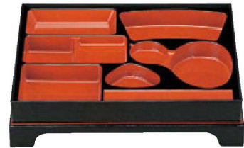
② [A] 尺5寸御膳松花堂用 D.X仕切 朱天黒 ¥3,650 (43.5×31.5×4.5) 櫃20