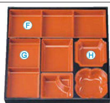
⑪ [A] 尺3寸長手松花堂用 F-1-81 2枚仕切 三ツ仕切 朱 F ¥1,100 (35.4×11.8×4.2) 1-358-3 [A] 8.5寸松花堂用 B仕切 朱天黒 G ¥1,050 (23.5×11.7×4) 1-245-16 [A] 8.5寸松花堂用 懷石仕切 朱天黒 H ¥1,250 (23.5×23.5×4)