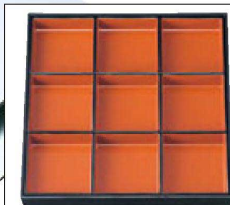
⑨ [A] 尺3寸角松花堂弁当 1-358-4X9; 華九ツ仕切 朱天黒 (9ヶ別々になります) ¥7,200 1-358-4 [A] 華角鉢 朱天黒 1ヶ ¥800 (11.8×11.8×4.4) 櫃50