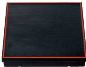
④ 1-256-1 [A] 尺3寸角千筋会席松花堂 黒天朱内黒塗 (仕切別) ¥5,900 (38×38×7.2) 櫃10