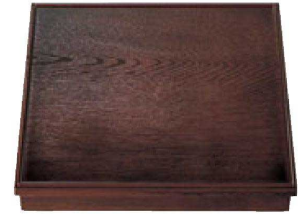
② 1-252-2 [A] 尺3寸角木目松花堂 溜 (仕切別) ¥6,400 (38×38×6.7) 櫃10