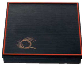
⑤ 1-256-2 [A] 尺3寸角千筋会席松花堂 黒天朱柳結び内黒塗 (仕切別) ¥6,250 (38×38×7.2) 櫃10