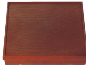
⑥ 1-256-3 [A] 尺3寸角千筋会席松花堂 溜内黒塗 (仕切別) ¥6,850 (38×38×7.2) 櫃10