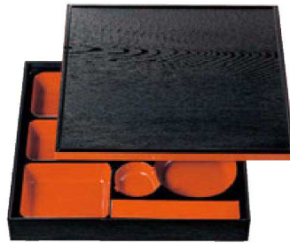
① 1-252-1 [A] 尺3寸角木目松花堂 黒瀾朱 (仕切別) ¥5,500 (38×38×6.7) 櫃10