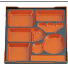
⑧ 1-253-2 [A] 尺3寸角松花堂用 D.X仕切 朱天黒 ¥2,650 (35.1×35.1×3.8) 櫃20