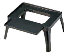
③ F-1-85 [A] 尺3寸角松花堂用 御膳足 黒 ¥4,000 (39.5×41×22.2)