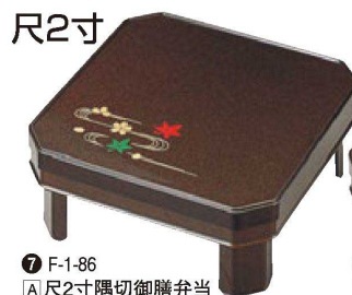
⑦ F-1-86 A 尺2寸隅切御膳弁当 梨地春秋内朱 (仕切付) ¥14,500 (36×36×16.3) 櫃10