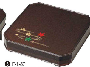
⑧ F-1-87 A 尺2寸隅切弁当 梨地春秋内朱 (仕切付) ¥13,000 (36×36×8) 櫃10