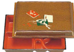
⑥ A 尺0寸宝生弁当 1-351-6 梨地万葉内朱 ¥4,700 (30×25×7.5) 櫃20