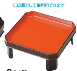
⑨ F-1-88 A 尺2寸お膳のみ 梨地内朱 ¥7,250 (36×36×16.3)