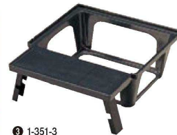
③ 1-351-3 A 新兼六足 黒 (尺2寸、尺5寸兼用) ¥3,800 (36.7×41.7×15) 櫃30

※全面に足が付きましたので安定性があります。前足2本は折畳みができ、収納スペースをとりません。又、積み重ねも可能です。