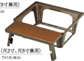
④ 1-250-7 A 新兼六足 梨地 (尺2寸、尺5寸兼用) ¥5,400 (36.7×41.7×15) 櫃30

※全面に足が付きましたので安定性があります。前足2本は折畳みができ、収納スペースをとりません。又、積み重ねも可能です。