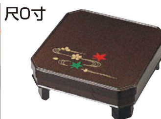
⑩ A 尺0寸隅切御膳弁当 F-1-89 梨地春秋内朱 (仕切付) ¥9,750 (30.2×30.2×11.8) 櫃20