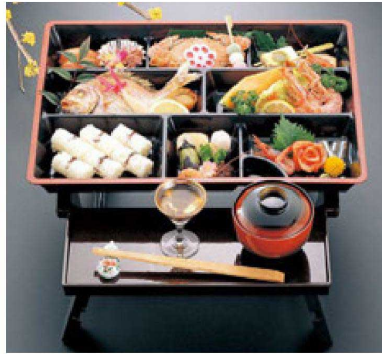
① 1-351-1 A 尺5寸宝生弁当 梨地ツタ内黒 ¥6,800 (44.4×33.4×7.2) 櫃20