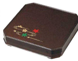
⑪ A 尺0寸隅切弁当 F-1-90 梨地春秋内朱 (仕切付) ¥9,100 (30.2×30.2×8) 櫃20