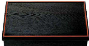
⑧ 1-242-5 [A] ニュー尺3寸長手木目松花堂 黒天朱 (仕切別) ¥3,500 (38.5×26.5×6.5) 梱20