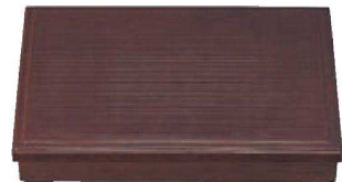
⑱ 1-243-7 [A] 尺3寸長手千筋松花堂 溜内黒塗 (仕切別) ¥5,000 (38×26.3×6.5) 梱20