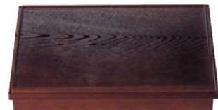
⑩ 1-262-3 [A] ニュー尺3寸長手木目松花堂 溜 (仕切別) ¥4,200 (38.5×26.5×6.5) 梱20