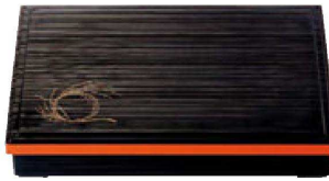
⑰ 1-243-6 [A] 尺3寸長手千筋松花堂 柳結び内黒塗 (仕切別) ¥4,800 (38×26.3×6.5) 梱20