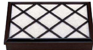
⑫ [A] 尺3寸長手松花堂用 障子蓋 黒 ¥3,100 (38.2×26.5×2) (内寸37.5×25.8)