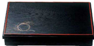
⑪ [A] ニュー尺3寸長手木目松花堂 黒木目天朱柳結び (仕切別) ¥4,000 (38.5×26.5×6.5) 梱20