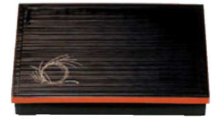
① A尺3寸千筋松花堂 柳結び内黒塗 (仕切別) ¥4,800 (38×26.3×6.5) 櫃20