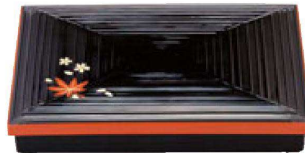
⑤ A尺3寸ロイヤル松花堂 黒測朱春秋 (仕切別) ¥5,800 (38.7×26.4×6.3) 櫃20