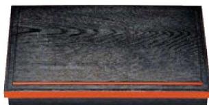
④ A尺3寸長手松花堂 黒木目測朱 朱ライン (仕切別) ¥4,800 (38.3×26.5×6.5) 櫃20