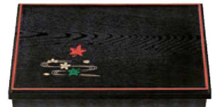
② Aニュー尺3寸長手木目松花堂 黒天朱春秋 (仕切別) ¥4,100 (38.5×26.5×6.5) 櫃20