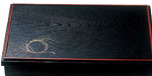
③ Aニュー尺3寸長手松花堂 黒木目天朱柳結び (仕切別) ¥4,800 (38.5×26.5×6.5) 櫃20