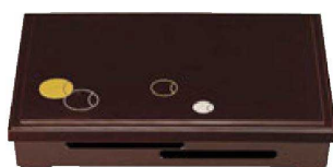
⑥ A尺3寸長手透かし松花堂 (内外) 溜つぼぽ (仕切別) ¥7,500 (38×26×6.5) 櫃20