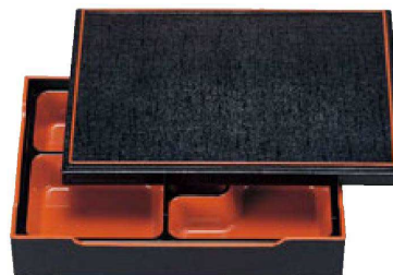
⑨ 1-371-6 A尺1寸長手雅松花堂 平蓋 黒布目天朱 (仕切付) ¥4,850 (33×25.2×7) 櫃20