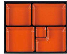
④ A尺1寸長手布目松花堂用 5ツ仕切 朱天黒 1-366-4 ¥1,500 (29.1×23.6×3.7) 櫃50