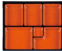
⑤ A尺1寸長手へぎ目松花堂用 6ツ仕切 朱天黒 1-366-3 ¥1,450 (29.1×23.8×3.5) 櫃50