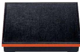
① A尺1寸長手布目松花堂 黒淵朱 (仕切別) 1-369-1 ¥3,150 (31.5×26×6.7) 櫃20