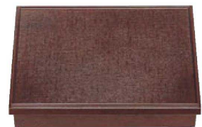
② A尺1寸長手布目松花堂 溜 (仕切別) 1-369-2 ¥3,450 (31.5×26×6.7) 櫃20