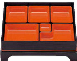
⑦ A尺1寸長手御膳千筋松花堂 黒天朱 (仕切別) 1-241-6 ¥3,300 (31.3×26×7) 櫃20