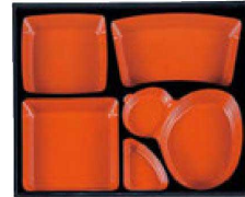
⑥ A尺1寸長手御膳松花堂用 ひさご仕切 朱天黒 1-366-5 ¥1,700 (29.1×23.6×3.9) 櫃50