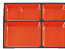
⑪ 1-374-6 A9寸長手弁当用 新仕切 朱天黒 ¥1,250 (25.4×19.2×3.7) 櫃60