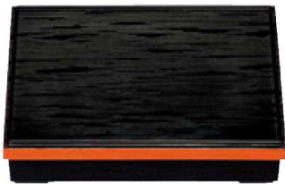
⑤ A9寸長手松花堂 1-238-5 黒へぎ目測朱 (仕切別) ¥1,800 (27.2×21.1×6) 櫃40