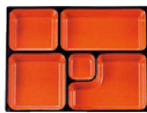
⑩ F-2-74 A9寸長手弁当用 仕切 朱天黒 ¥1,000 (25.5×19.7×3.8) 櫃60