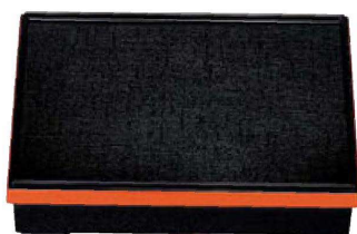
⑬ F-2-16 A9寸長手松花堂 黒布目測朱 (仕切別) ¥2,000 (27.2×21.1×6) 櫃40