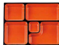
⑮ F-2-74 A9寸長手弁当用仕切 朱天黒 ¥1,000 (25.5×19.7×3.8) 櫃60