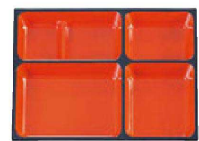
⑯ 1-374-6 A9寸長手弁当用新仕切 朱天黒 ¥1,250 (25.4×19.2×3.7) 櫃60