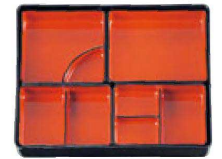
⑫ C-1-70 A9寸長手弁当用 会席仕切セット 朱天黒 ¥3,050 櫃60