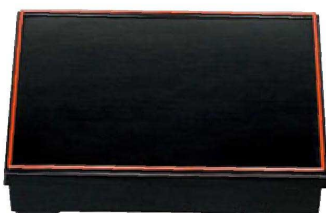
⑨ A9寸長手松花堂 1-239-5 黒千筋天朱 (仕切別) ¥1,950 (27.2×21.1×6) 櫃40