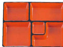
⑦ 1-374-5 A9寸長手三里弁当用 仕切 朱天黒 ¥1,000 (25.5×19.7×3.8) 櫃60