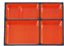
⑧ 1-374-6 A9寸長手弁当用 新仕切 朱天黒 ¥1,250 (25.4×19.2×3.7) 櫃60