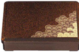
③ A9寸長手三里弁当 1-374-3 梨地二色菊 (仕切別) ¥2,500 (27.2×21.2×6.3) 櫃40