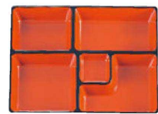
④ A9寸長手三里弁当用 1-374-5 仕切 朱天黒 ¥1,000 (25.5×19.7×3.8) 櫃60