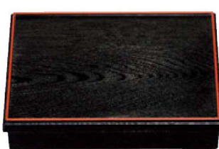
⑭ 1-239-6 A9寸長手松花堂 黒木目天朱 (仕切別) ¥2,000 (27.2×21.1×6) 櫃40