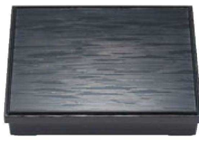
⑥ A9寸長手松花堂 F-4-59 総黒へぎ目 (仕切別) ¥1,800 (27.2×21.1×6) 櫃40