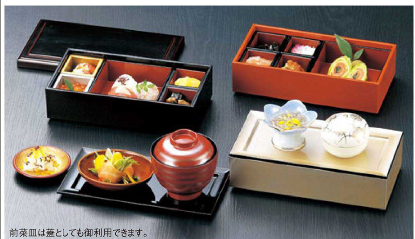
前菜皿は蓋としても御利用できます。

③ A 慶祥弁当 生そば F-3-89 ¥4,000 (32.2×20.3×5) 桐40 S-7-25A 笹竹ス(15φ) ¥400 (15φ) S-10-49 P.P.P.P測付クリーム竹ス(15φ丸) ¥370 (15φ)