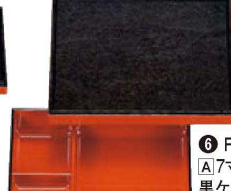
⑥ F-1-12 A 7寸長手固定弁当 黒ケヤキ木目測朱 オヤ 内朱 ¥2,200 (20.3×17.9×4.9) 幅60