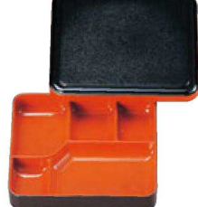
⑫ A WF-20 6.5寸長手副食入れ F-2-33 黒木目内朱 ¥2,050 (19×17×4.8) 幅40