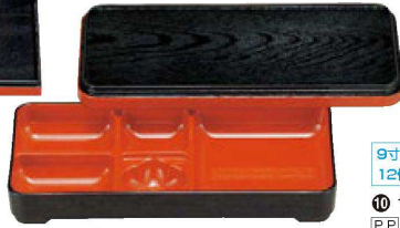
⑨ 1-414-1 A 9寸長手副食弁当 黒木目内朱 ¥2,450 (27×12.1×4.6) 幅60