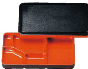
⑪ A WF-30 尺0寸長手 F-2-32 黒木目内朱 ¥2,750 (29.7×17.1×4.2) 幅40