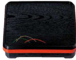
② 1-414-5 A 6.5寸角副食弁当 黒木目内朱露草 ¥2,500 (19.8×19.8×4.6) 幅50