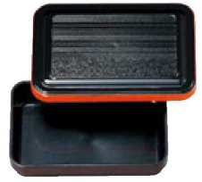
⑭ F-2-34 TA F-161 ライス入れ 黒パール測朱 ¥1,400 (17.7×12.4×4.3) 幅100