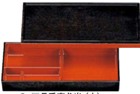
④ A 長手京弁当(小) F-1-14 黒ケヤキ木目測朱 オヤ 内朱 ¥2,300 (25.7×12×4.6) 幅60