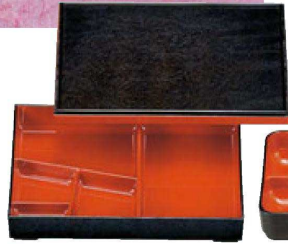
⑧ F-1-13 A 8.5寸長手固定弁当 黒ケヤキ木目測朱 オヤ 内朱 ¥2,700 (25.5×17×4.9) 幅40