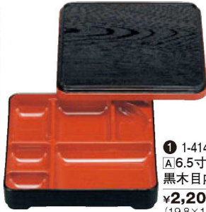
① 1-414-4 A 6.5寸角副食弁当 黒木目内朱 ¥2,200 (19.8×19.8×4.6) 幅50