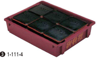
③ 1-111-4 P.P 特大御料理コンテナ ブラウンNo.1 ¥5,250 外寸(67.5×52.5×14.5)内寸(61.5×49×14) 幅10