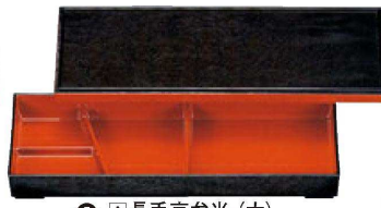
⑤ A 長手京弁当(大) F-1-15 黒ケヤキ木目測朱 オヤ 内朱 ¥2,800 (34.2×12.2×4.8) 幅40