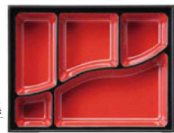
⑤ F-4-44 A 8寸長手用D.X仕切 朱天黒 ¥1,000 (22.3×16.8×3.2)