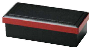
① F-4-34 A 6寸長手布目ライス入れ 黒測朱 ¥1,350 (19×9.5×6) 欄80