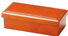
⑪ F-4-36 A 6寸長手布目ライス入れ 春慶 ¥1,800 (19×9.5×6) 欄80