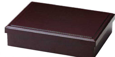
⑨ F-4-42 A 8寸長手布目副食弁当 新溜 (仕切別) ¥2,250 (24.2×19.2×6) 欄50