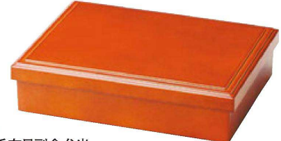
⑭ F-4-43 A 8寸長手布目副食弁当 春慶 (仕切別) ¥2,550 (24.2×19.2×6) 欄50