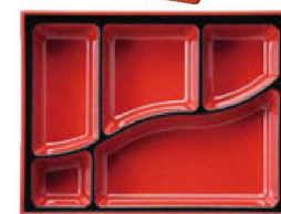
⑮ F-4-44 A 8寸長手用D.X仕切 朱天黒 ¥1,000 (22.3×16.8×3.2)