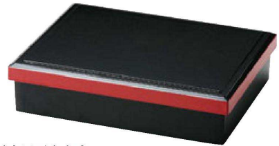
④ F-4-41 A 8寸長手布目副食弁当 黒測朱 (仕切別) ¥1,900 (24.2×19.2×6) 欄50