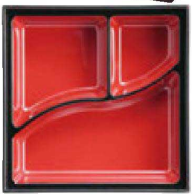
⑧ F-4-40 A 6寸角用D.X仕切 朱天黒 ¥750 (17×17×3.1)