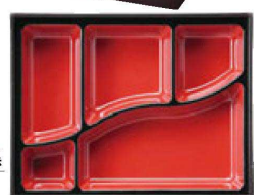
⑩ F-4-44 A 8寸長手用D.X仕切 朱天黒 ¥1,000 (22.3×16.8×3.2)