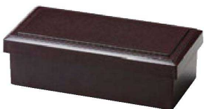
⑥ F-4-35 A 6寸長手布目ライス入れ 新溜 ¥1,400 (19×9.5×6) 欄80