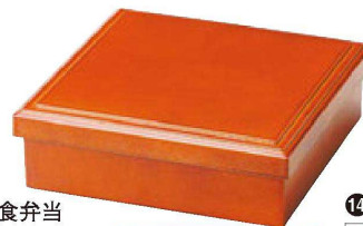
⑫ F-4-39 A 6寸角布目副食弁当 春慶 (仕切別) ¥2,400 (18.9×18.9×6) 欄60