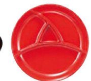
⑩ F-2-40 [M] 8寸盛込椀用 弁当仕切朱 ¥2,500 (22.2φ×2.5) 榧50