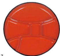
④ 1-424-7 [A] 尺0寸御殿盛込椀用 弁当仕切朱 ¥2,200 (28.7φ×3.1) 榧40