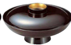
⑨ W-7-17 [M] 8寸盛込椀 溜つば金 (仕切別) ¥6,600 (23.9φ×12.3) 楕40