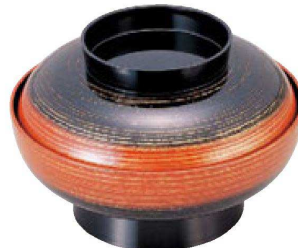
⑤ 1-702-5 [A] 尺2寸盛込椀 レインボー内黒塗 (仕切別) ¥13,900 (37φ×24.5) 榧10