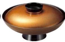
⑧ W-7-16 [M] 8寸盛込椀 金梨地つば黒 (仕切別) ¥6,400 (23.9φ×12.3) 楕40