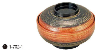
① 1-702-1 [A] 6.5寸盛込椀 レインボー内黒塗 (仕切別) ¥4,400 (19.8φ×13) 榧40