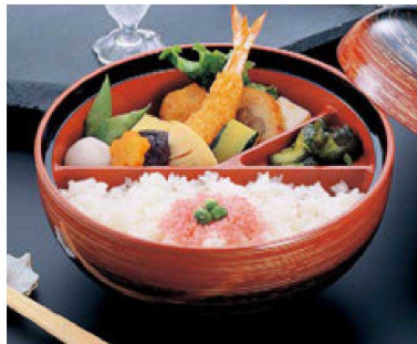
① 1-702-1 [A] 6.5寸盛込椀 レインボー内黒塗 (仕切別) ¥4,400 (19.8φ×13) 楕40