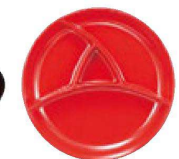
⑩ F-2-40 [M] 8寸盛込椀用 弁当仕切朱 ¥2,500 (22.2φ×2.5) 楕50