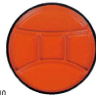
⑥ 1-424-10 [A] 尺2寸盛込椀用 弁当仕切朱 ¥2,600 (35.7φ×4.7) 榧30