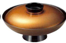
⑧ W-7-16 [M] 8寸盛込椀 金梨地つば黒 (仕切別) ¥6,400 (23.9φ×12.3) 榧40