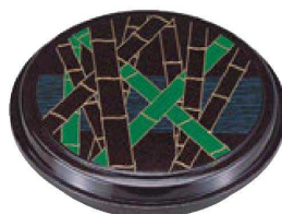
⑪ 1-425-2 [A] 丸オードブル弁当 茶パール竹内朱 (仕切固定) ¥5,950 (36.5φ×7.5) 楕20