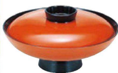
⑦ W-2-58 [M] 8寸盛込椀 朱 (仕切別) ¥6,300 (23.9φ×12.3) 榧40