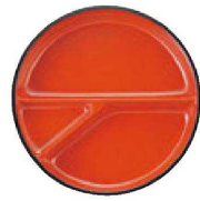
② 1-424-4 [A] 6.5寸盛込椀 弁当仕切朱 ¥1,000 (18.8φ×3.7) 榧80