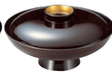
⑨ W-7-17 [M] 8寸盛込椀 溜つば金 (仕切別) ¥6,600 (23.9φ×12.3) 榧40