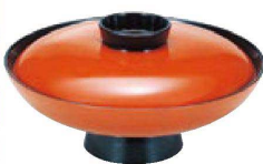
⑦ W-2-58 [M] 8寸盛込椀 朱 (仕切別) ¥6,300 (23.9φ×12.3) 楕40