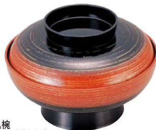
③ 1-702-4 [A] 尺0寸盛込椀 レインボー内黒塗 (仕切別) ¥9,400 (30φ×20) 榧20