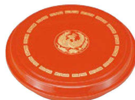
⑫ 1-425-3 [A] 丸オードブル弁当 中華内朱 (仕切固定) ¥5,950 (36.5φ×7.5) 榧20