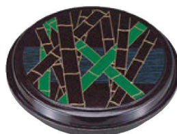
⑪ 1-425-2 [A] 丸オードブル弁当 茶パール竹内朱 (仕切固定) ¥5,950 (36.5φ×7.5) 榧20