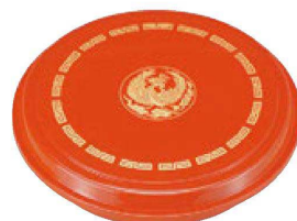
⑫ 1-425-3 [A] 丸オードブル弁当 中華内朱 (仕切固定) ¥5,950 (36.5φ×7.5) 楕20