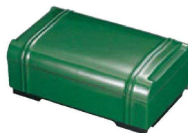
㉗ A竹型弁当 グリーン(仕切別) F-3-44 ¥2,450 (25×15.8×10) 櫃40