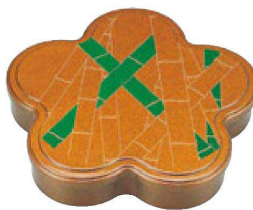
③ 1-423-1 A光梅弁当 金梨地竹林 (仕切別) ¥5,050 (33×30×5.9) 櫃20