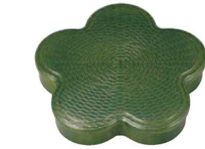
① A竹目光梅弁当 グリーン F-3-10A 蓋 ¥2,250 (33×30×2) 櫃60 F-3-10 身 ¥2,900 (32×28.8×5.5) 櫃30