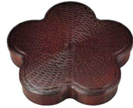
② A竹目光梅弁当 溜 F-3-11A 蓋 ¥2,250 (33×30×2) 櫃60 F-3-11 身 ¥2,900 (32×28.8×5.5) 櫃30