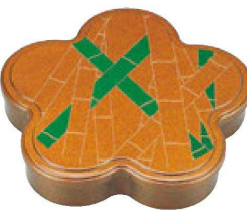
③ 1-423-1 A光梅弁当 金梨地竹林 (仕切別) ¥5,050 (33×30×5.9) 櫃20