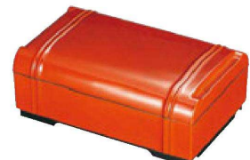
㉘ A竹型弁当 春慶(仕切別) F-3-45 ¥2,850 (25×15.8×10) 櫃40