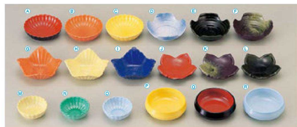
A ⑧ TA ABS3.8寸菊鉢 黒内朱 ¥700 (11.3φ×3.3) 櫃200 B ⑨ TA ABS3.8寸菊鉢 柿釉 ¥700 (11.3φ×3.3) 櫃200 C ⑩ TA ABS3.8寸菊鉢 黄 ¥700 (11.3φ×3.3) 櫃200 D ⑪ A四ツ山小鉢 吹黒 ¥1,200 (11.8×11.8×4.2) 櫃100 E ⑫ A四ツ山小鉢 縹部 ¥1,300 (11.8×11.8×4.2) 櫃100 F ⑬ A四ツ山小鉢 岩縹部 ¥1,300 (11.8×11.8×4.2) 櫃100 G ⑭ A菊四方上り鉢 柿釉 ¥1,100 (10.7×10.7×4.5) 櫃200 H ⑮ A菊四方上り鉢 淡黄 ¥1,100 (10.7×10.7×4.5) 櫃200 I ⑯ A菊四方上り鉢 瑠璃 ¥1,100 (10.7×10.7×4.5) 櫃200 J ⑰ A新もみじ皿 朱 ¥1,150 (11.2×11×3.2) 櫃200 K ⑱ A新もみじ皿 岩縹部 ¥1,550 (11.2×11×3.2) 櫃200 L ⑲ A新もみじ皿 縹部 ¥1,550 (11.2×11×3.2) 櫃200 M ⑳ A2.6寸菊型鉢 黄 ¥650 (8φ×3.2) 櫃200 N ㉑ A2.6寸菊型鉢 ヒワグリーン ¥650 (8φ×3.2) 櫃200 O ㉒ A2.6寸菊型鉢 青縹 ¥650 (8φ×3.2) 櫃200 P ㉓ Aタイコ丸鉢 黄 ¥1,000 (11φ×3.9) 櫃200 Q ㉔ Aタイコ丸鉢 黒内朱 ¥1,000 (11φ×3.9) 櫃200 R ㉕ Aタイコ丸鉢 青縹 ¥1,000 (11φ×3.9) 櫃200