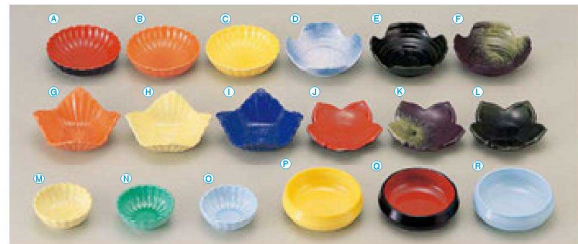
A ⑧ TA ABS3.8寸菊鉢 黒内朱 ¥700 (11.3φ×3.3) 櫃200 B ⑨ TA ABS3.8寸菊鉢 柿釉 ¥700 (11.3φ×3.3) 櫃200 C ⑩ TA ABS3.8寸菊鉢 黄 ¥700 (11.3φ×3.3) 櫃200 D ⑪ A四ツ山小鉢 吹黒 ¥1,200 (11.8×11.8×4.2) 櫃100 E ⑫ A四ツ山小鉢 縹部 ¥1,300 (11.8×11.8×4.2) 櫃100 F ⑬ A四ツ山小鉢 岩縹部 ¥1,300 (11.8×11.8×4.2) 櫃100 G ⑭ A菊四方上り鉢 柿釉 ¥1,100 (10.7×10.7×4.5) 櫃200 H ⑮ A菊四方上り鉢 淡黄 ¥1,100 (10.7×10.7×4.5) 櫃200 I ⑯ A菊四方上り鉢 瑠璃 ¥1,100 (10.7×10.7×4.5) 櫃200 J ⑰ A新もみじ皿 朱 ¥1,150 (11.2×11×3.2) 櫃200 K ⑱ A新もみじ皿 岩縹部 ¥1,550 (11.2×11×3.2) 櫃200 L ⑲ A新もみじ皿 縹部 ¥1,550 (11.2×11×3.2) 櫃200 M ⑳ A2.6寸菊型鉢 黄 ¥650 (8φ×3.2) 櫃200 N ㉑ A2.6寸菊型鉢 ヒワグリーン ¥650 (8φ×3.2) 櫃200 O ㉒ A2.6寸菊型鉢 青縹 ¥650 (8φ×3.2) 櫃200 P ㉓ Aタイコ丸鉢 黄 ¥1,000 (11φ×3.9) 櫃200 Q ㉔ Aタイコ丸鉢 黒内朱 ¥1,000 (11φ×3.9) 櫃200 R ㉕ Aタイコ丸鉢 青縹 ¥1,000 (11φ×3.9) 櫃200