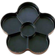
⑥ 1-423-4 A光梅弁当用仕切 黒 ¥1,150 (30.8×27.6×3.4) 櫃40