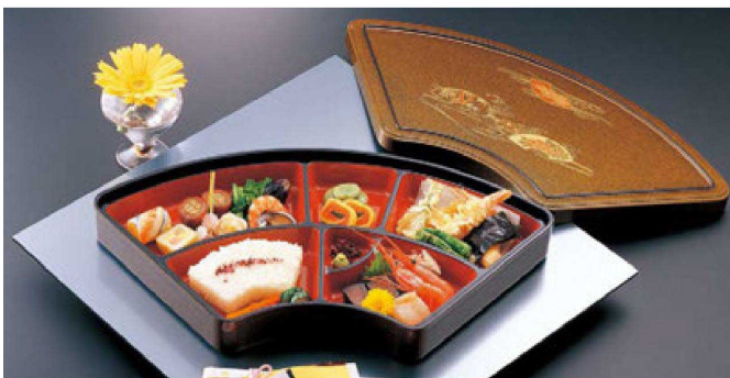
㉖ A(大)扇型弁当 梨地扇面天黒 (仕切付) [限定品] 1-425-1 ¥8,000 (47.5×23.5×5.5) 櫃10