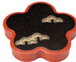
④ 1-423-2 A光梅弁当 朱パール若松 (仕切別) ¥5,250 (33×30×5.9) 櫃20