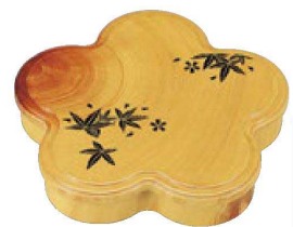
⑤ 1-423-3 A光梅弁当 花梨春秋内黒塗 (仕切別) ¥8,500 (33×30×5.9) 櫃20