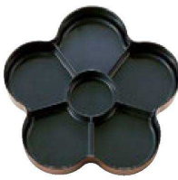
⑥ 1-423-4 A光梅弁当用仕切 黒 ¥1,150 (30.8×27.6×3.4) 櫃40