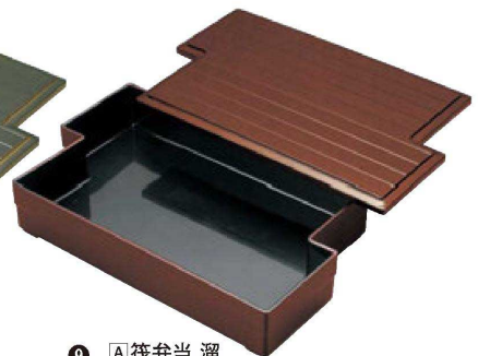
⑨ A筏弁当 溜 F-2-79 蓋 ¥2,150 (37.2×22.8×1.6) 梱80 F-2-80 親 ¥2,300 (37.2×22.5×6.5) 梱40