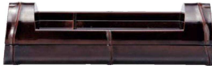
⑤ A竹姫弁当 溜内溜塗 上段 S-7-94 ¥3,050 (36.1×10.3×5.9)