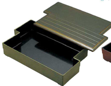
⑧ A筏弁当 グリーン F-2-77 蓋 ¥2,150 (37.2×22.8×1.6) 棚80 F-2-78 親 ¥2,300 (37.2×22.5×6.5) 棚40