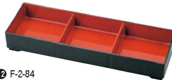
⑩ F-2-84 A筏弁当用大仕切三ツ仕切 内朱天黒 1ヶ ¥1,300 (32.8×10.8×4.6)