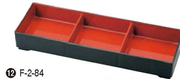
⑫ F-2-84 A筏弁当用大仕切三ツ仕切 内朱天黒 1ヶ ¥1,300 (32.8×10.8×4.6)