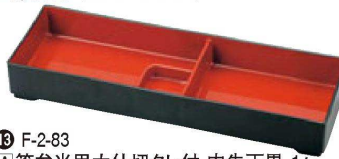
⑪ F-2-83 A筏弁当用大仕切タレ付 内朱天黒 1ヶ ¥1,300 (32.8×10.8×4.6)