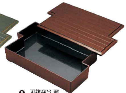
⑨ A筏弁当 溜 F-2-79 蓋 ¥2,150 (37.2×22.8×1.6) 棚80 F-2-80 親 ¥2,300 (37.2×22.5×6.5) 棚40