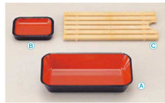
⑦ A 1-519-3 A中子(1ヶ) ¥700 (16.3×8.8×3.4) B 1-519-4 Aのぞき ¥550 (7.9×5.9×1.5) C 1-519-5 APスノ子 ¥650 (18.1×8×1)