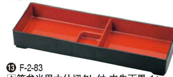
⑬ F-2-83 A筏弁当用大仕切タレ付 内朱天黒 1ヶ ¥1,300 (32.8×10.8×4.6)