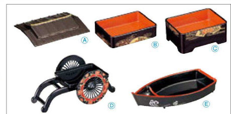
⑨ 徳川弁当用オプション