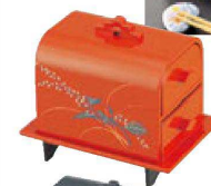
⑤ 1-427-3 A 桃山弁当 朱露草内黒塗 ¥6,900 (18.5×12.9×16.3) 櫃30