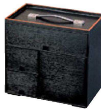
③ A 野立弁当 黒天朱 仕切付 1-426-5 (長皿・武蔵野椀別) 本体のみ ¥9,900 (24.2×14.6×22.4) 櫃10