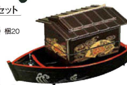
⑧ A 徳川弁当 茶パール扇面 屋形舟付2段セット ¥9,400 (33×17.2×16) 櫃20