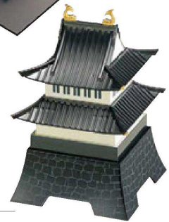
② 1-427-5 A お城弁当 拾萬石(3段) ¥8,600 (18×18×28) 櫃20