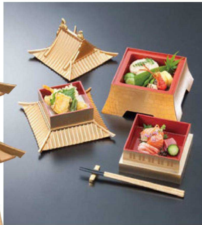
① F-4-75 A お城弁当 金塗り(3段) ¥17,800 (18×18×28) 櫃20