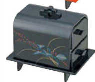
⑥ 1-427-4 A 桃山弁当 黒露草内朱塗 ¥6,900 (18.5×12.9×16.3) 櫃30